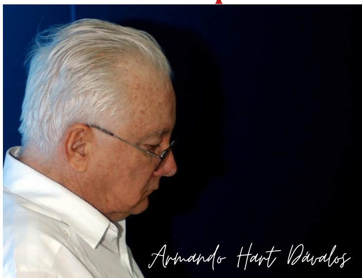
Armando Hart Dávalos

El revolucionario Armando Hart Dávalos legó a la posteridad una vasta obra literaria, cultural, política y educativa cuya esencia radica en la vida y obra del más universal de los cubanos: José Martí.