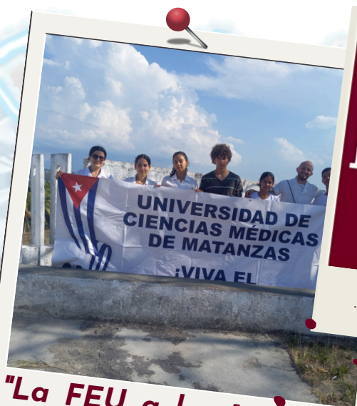
"La FEU a los 103 años de lucha y esperanza"

La vitalidad de la FEU reside precisamente en su capacidad para dialogar con su tiempo, sin perder la esencia de su proyecto fundacional. La organización debe ser un espacio de debate crítico y constructivo, donde el conocimiento científico y humanista se una a un profundo sentido ético.