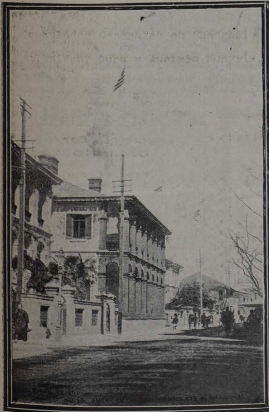
Consulados Generales, en Shanghai, de Estados Unidos, Cuba y Austria Hungria