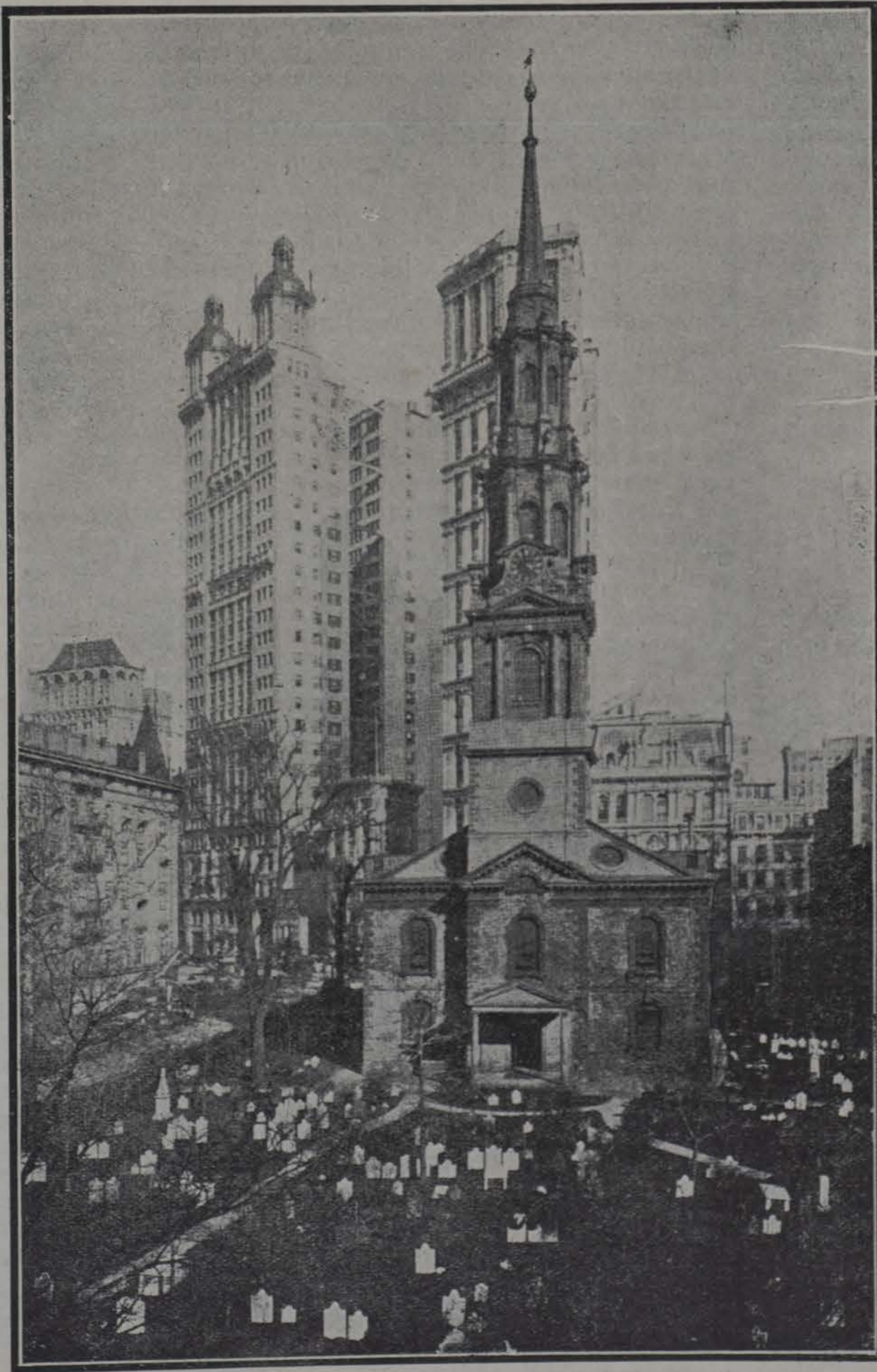
IGLESIA "ST. PAUL," NUEVA YORK

Todos los perfumes tienen su atractivo, á excepción de aquellos cuya base es el almizcle; por más que se haga para impedirlo, ese olor penetra, se fija, y se hace tanto más in-