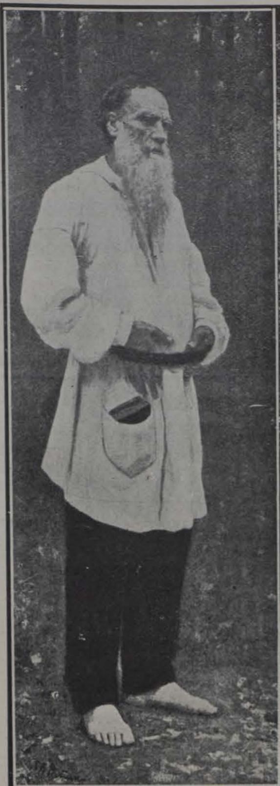
El Conde León Tolstoy en su jardín Jescalzo y en traje de campesino

Tolstoy en su juventud fué el hombre frívolo y elegante, amante de los placeres de la vida, favorito de la corte, militar y gran señor. Más tarde trocóse en