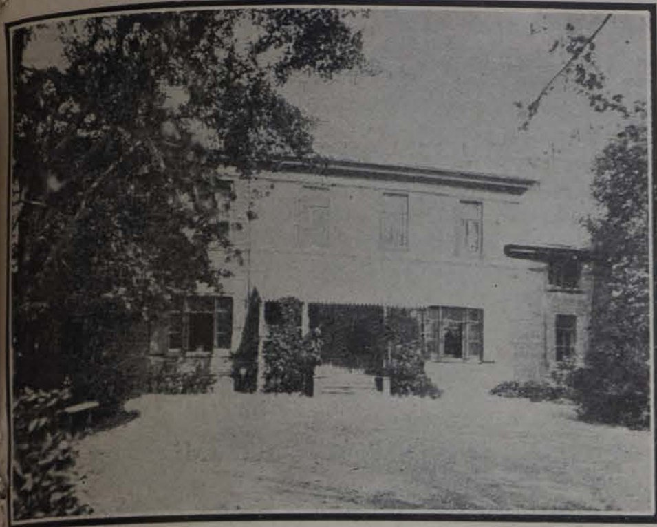
Casa de Tolstoy en Moscow