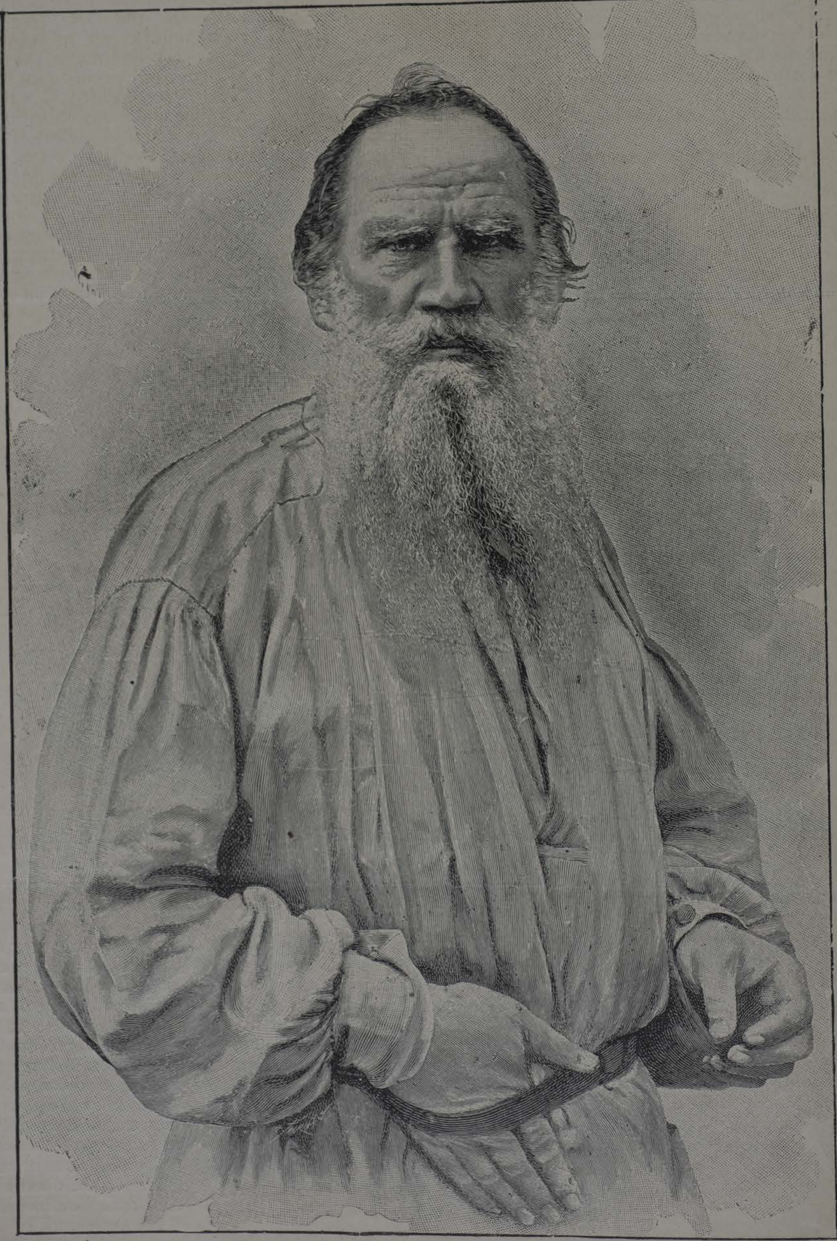
CONDE LEON TOLSTOY

Cuyo octogésimo aniversario han celebrado en Rusia todos los elementos progresistas