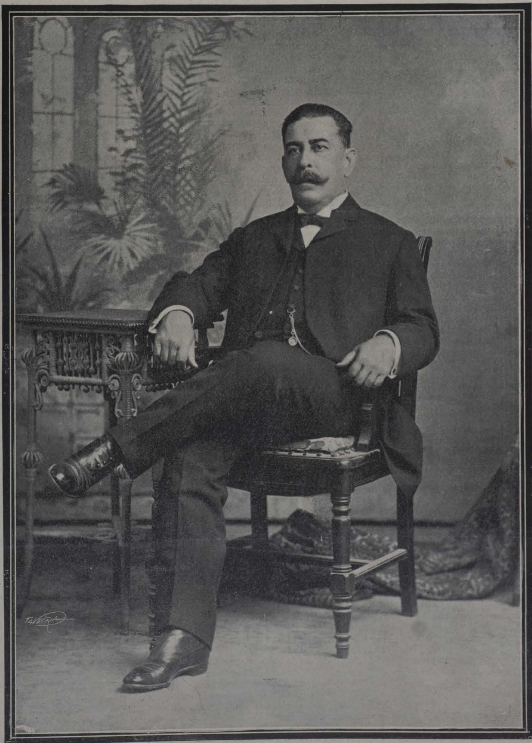
GENERAL JOSE MIGUEL GOMEZ

Registrada en la Administrac ón de Correos de la Habana y acogida á la franquicia postal como Correspondencia de segunda clase