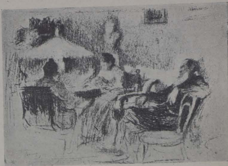
Tolstoy en la intimidad de su hogar

el cortar los brotes de una planta que se pretendiese destruir. No moriría, crecería de un modo irregular, y nada más.