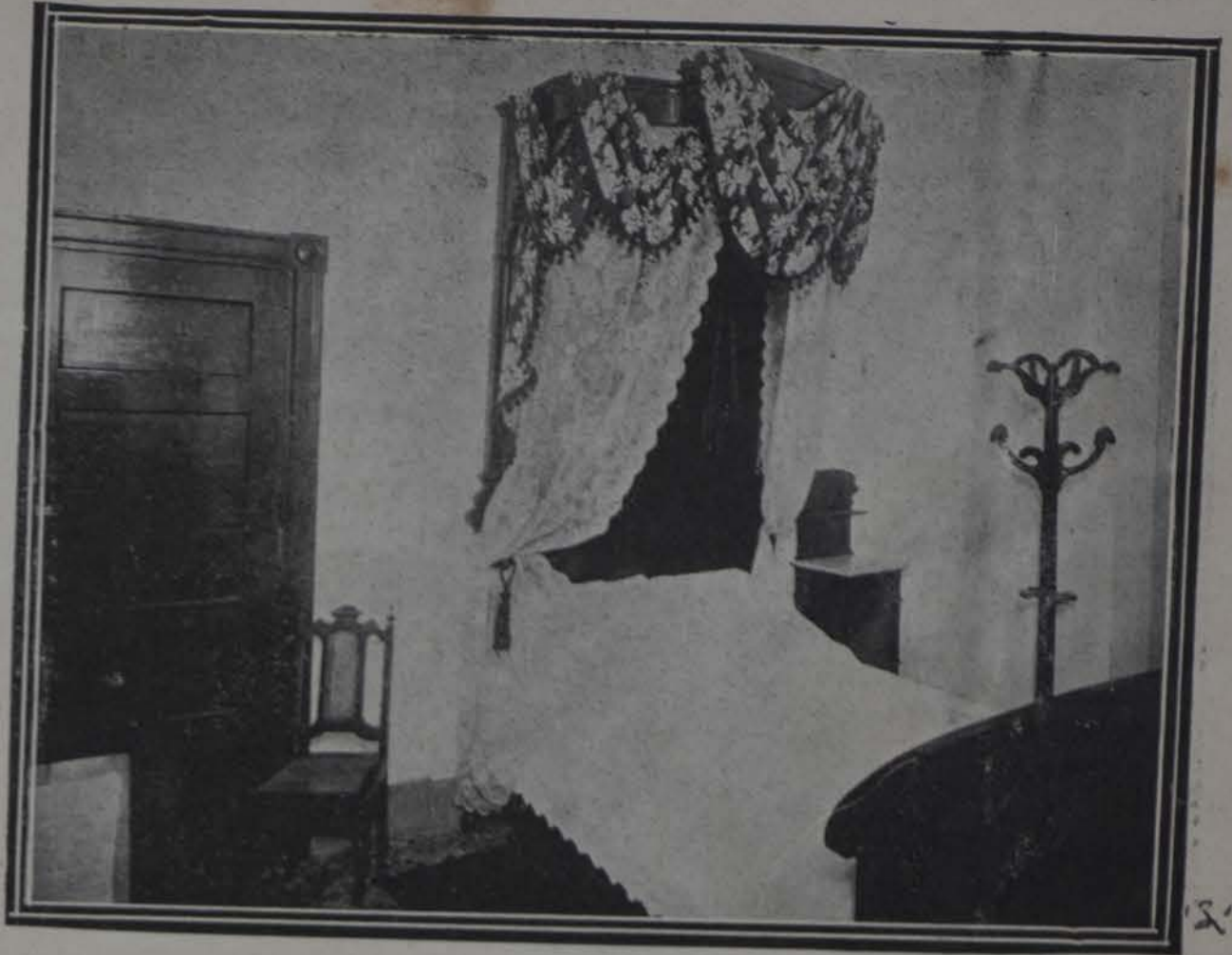
Interior de una habitación del gran hotel "Sevilla"