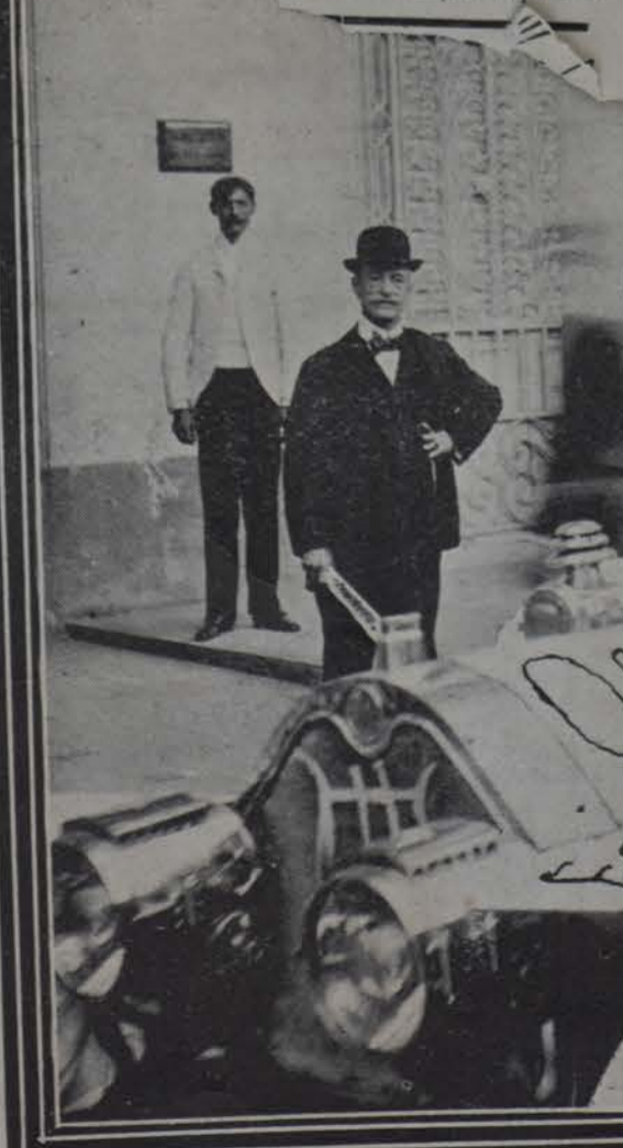
LOGO INVERNAL.—Carroza literaria que circuló en el paseo del domingo último dedicada por sus actores á Hector de Saavedra