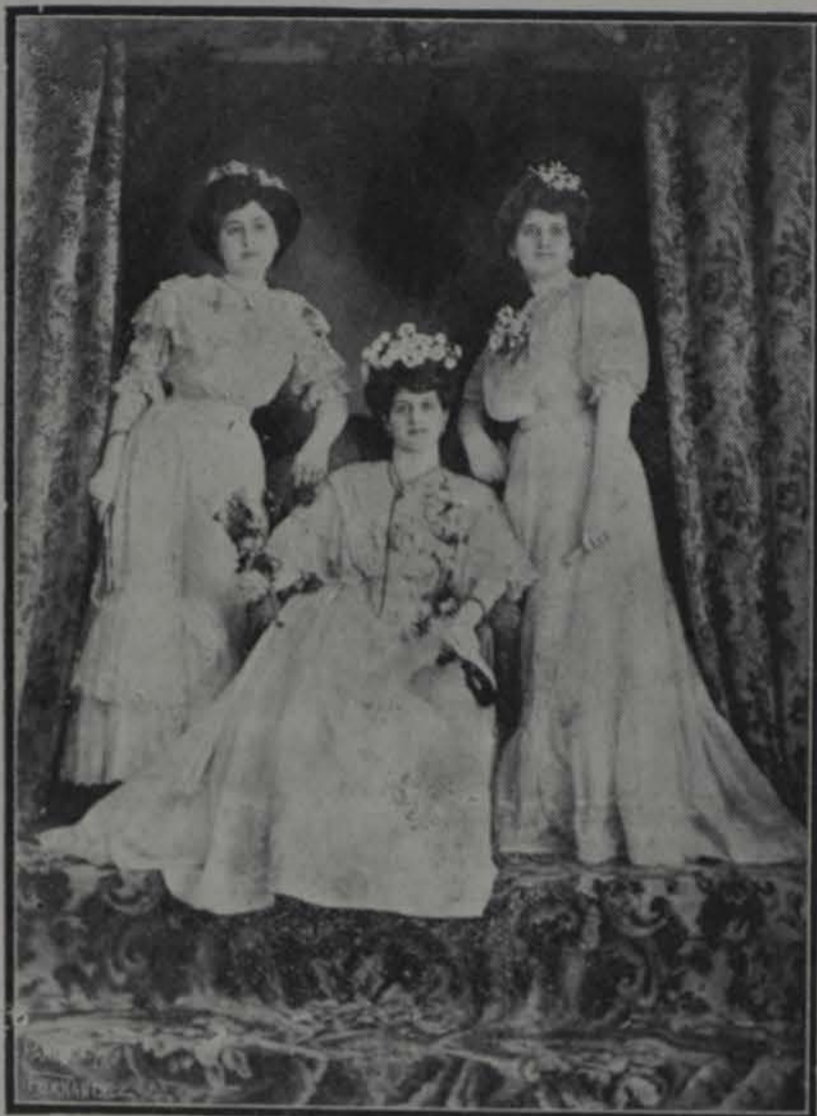
LA REINA DEL CARNAVAL Y DOS DE SUS DAMAS

En la Habana hace poco se estableció uno de esos centros, que aún no es más que una manifestación embrionaria del desarrollo que alcanzan en otras ciudades del mundo. Fundada con las mismas bases y proponiéndose los mismos fines que ellas, no dudamos que alcanzará el grado de esplendor, externo, en sus magníficas construcciones; é interno, en la organización completa de sus propósitos de sociabilidad que han logrado ya las de su índole en otras ciudades.