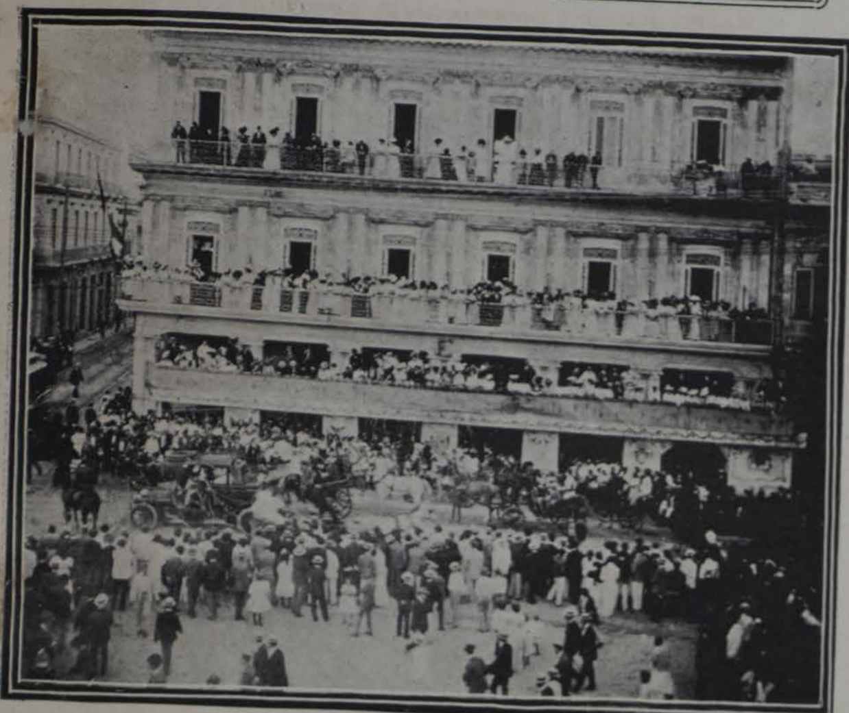
Aspecto del edificio que ocupan el Ateneo, Casino Español y Centro Alemán, durante el paseo del domingo último

El sábado se despidieron de la temporada carnavalesca, rindiéndole culto a Dios Momo, las Sociedades del Vedado y Liceo de Guanabacoa.