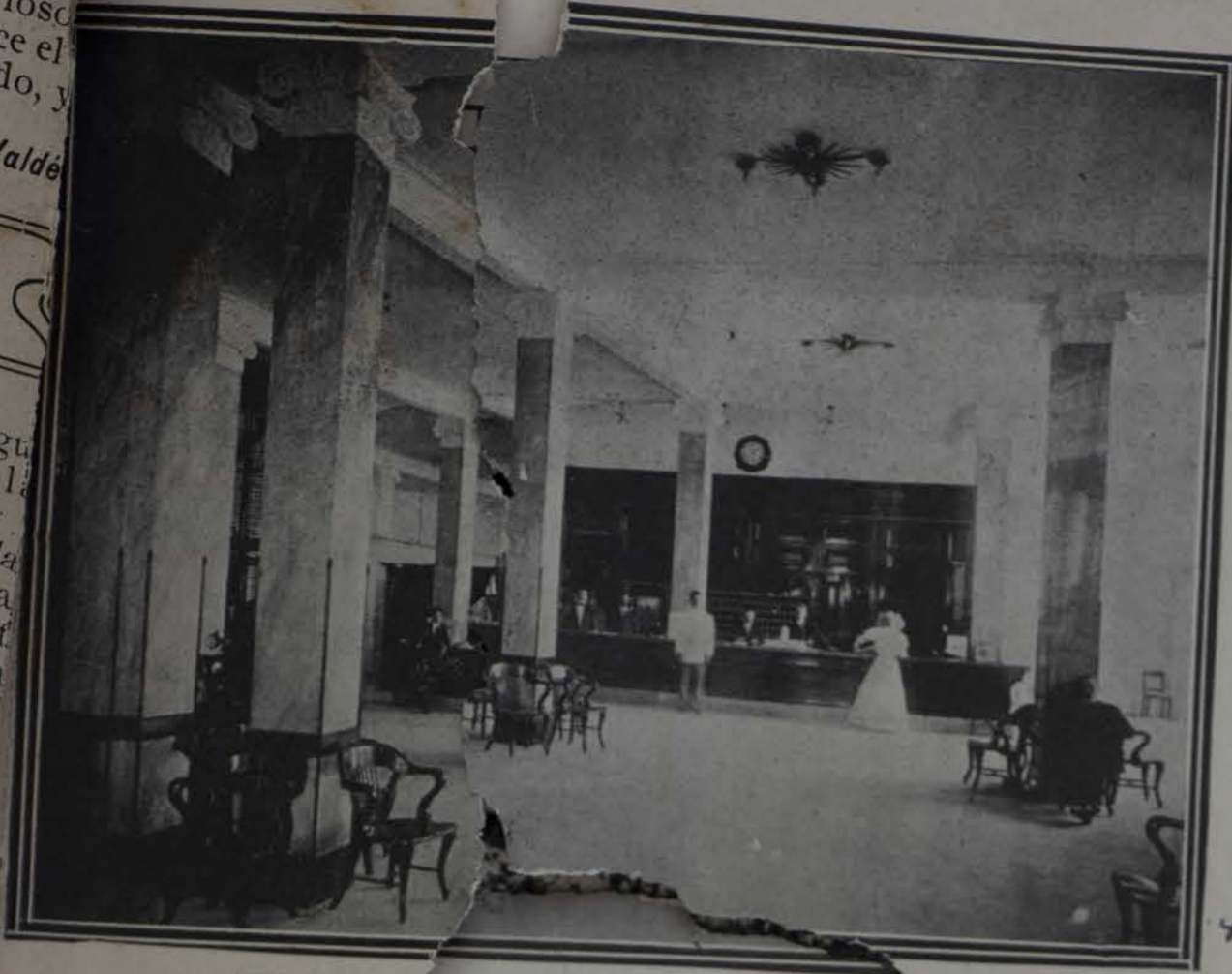
hall de la entrada del gran hotel "Sevilla"