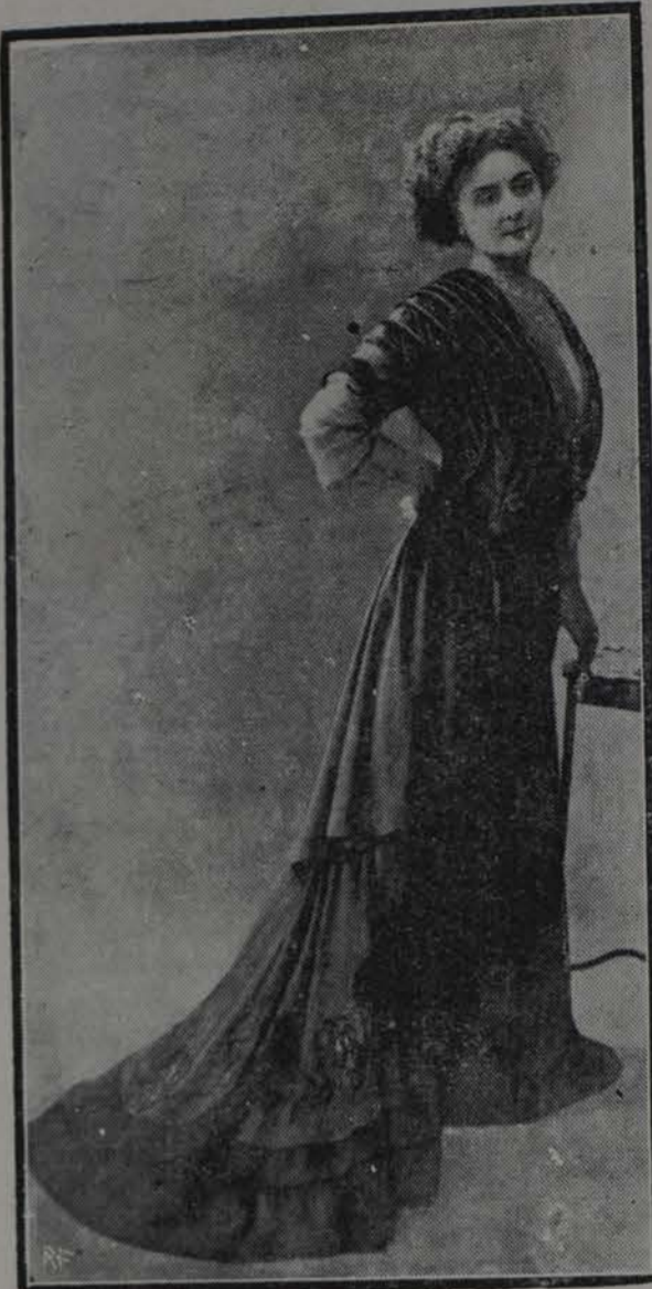
TRAJE DE RECEPCION INTIMA

Es el traje de nuestro grabado de terciopelo azul pavorreal, de una elegancia exquisita.