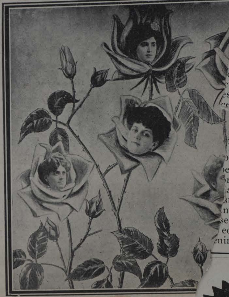
LA REINA DEL CARNAVAL Y SU...