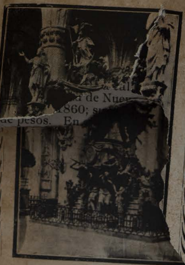
PULPITO DE LA CATEDRAL DE BRUSELAS

y para describir cuanto en ella se admira, se hace necesario poseer una inteligencia y erudición superiores.