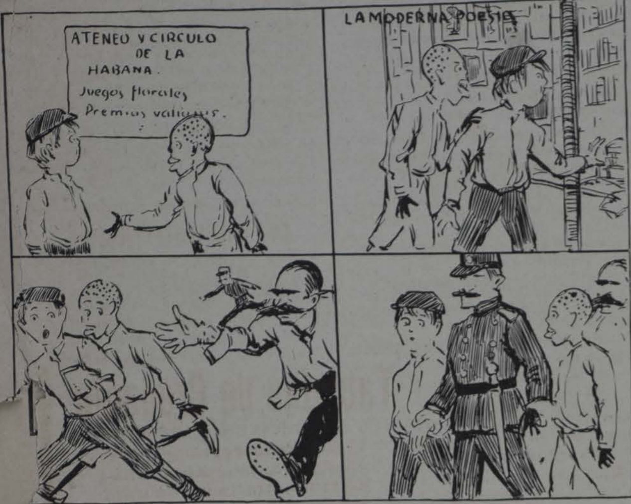
3 - Ataja! les gritó... ¿quién lo diría? el hombre de LA MODERNA POESIA.

1 - Quieres gloria, Buchin? Quieres dinero? Pues hay que entrar tambien en el florero. 2 - Pa copiar un soneto y estrambote Un tomo le cogemos a Don Pote.