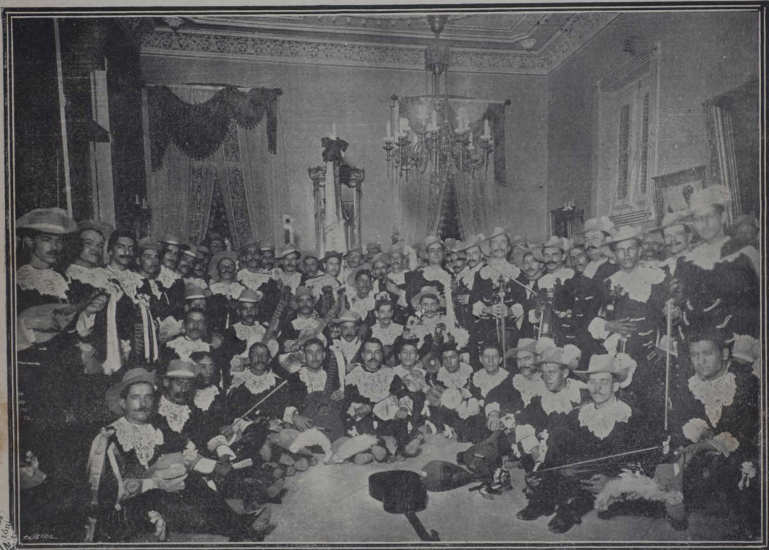
LOS TROVADORES GALLEGOS EN SU VISITA AL DIRECTOR DE "CUBA Y AMERICA"