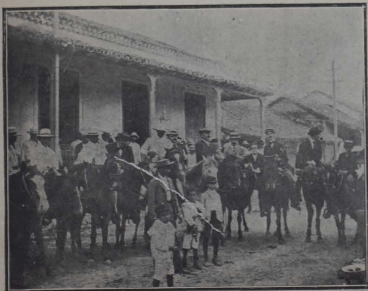
Constitución de un comité del Centro Canario en Gijón