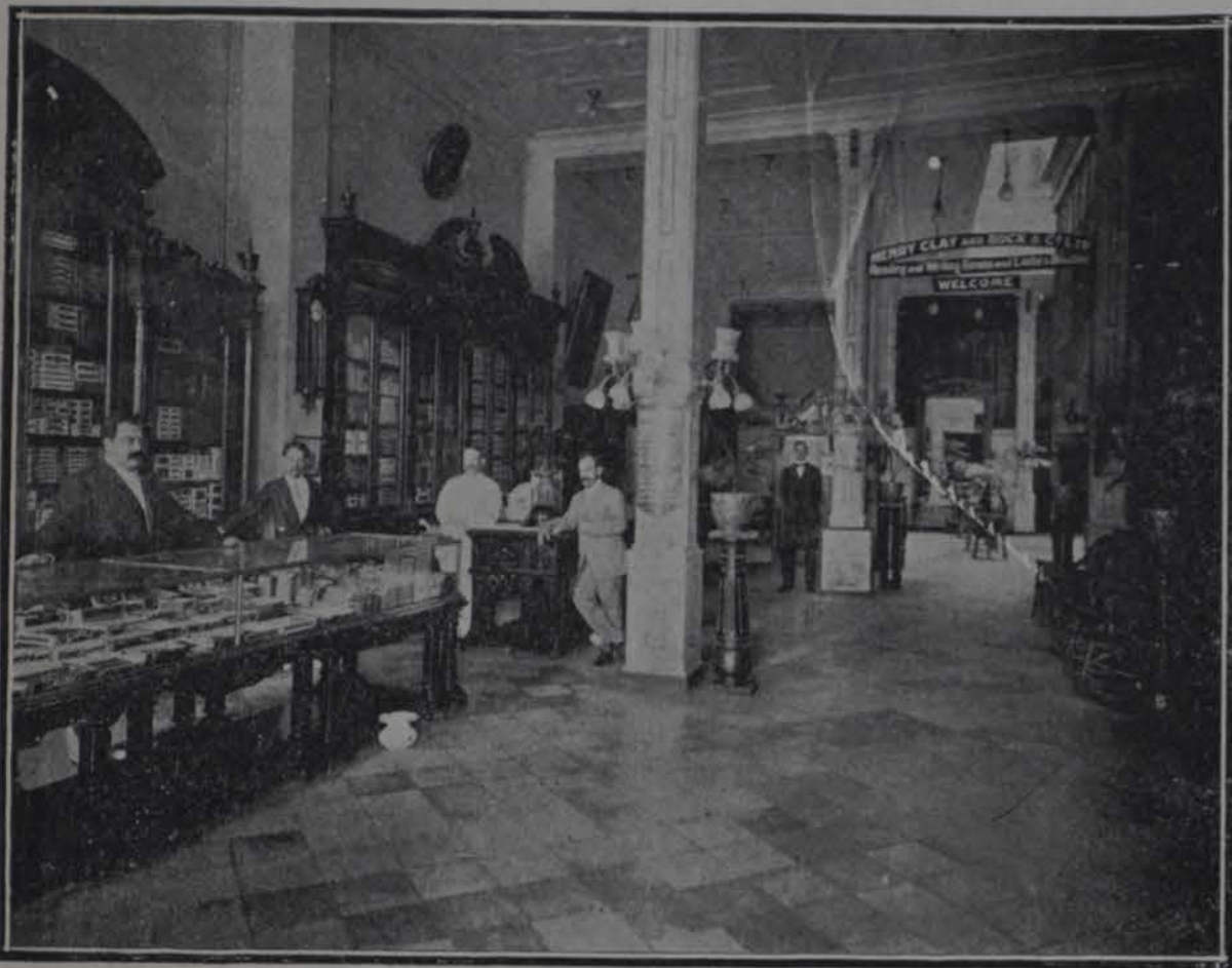
Los mostrarios de tabacos del "Salón Echemendía"