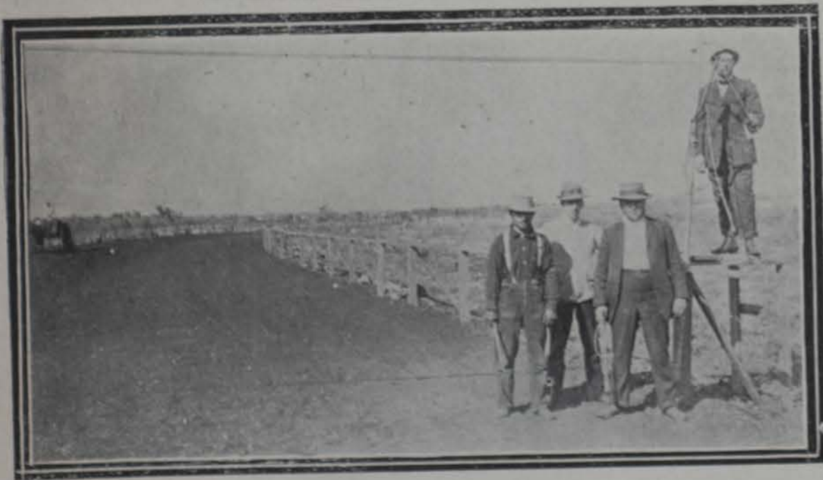
La señal de partida para los Jockeys en la pista