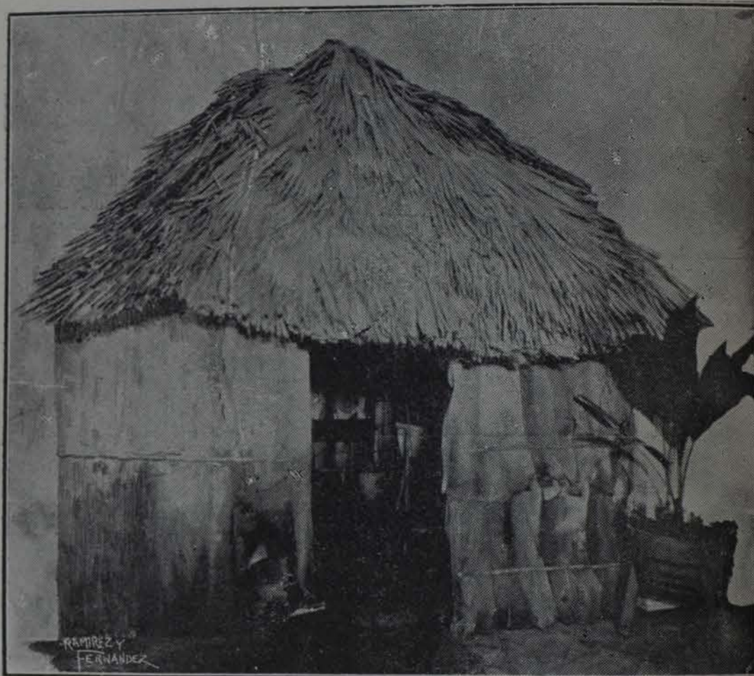
Un lindo bohío cubano que contiene reliquias históricas en el "Salón Echemendía"