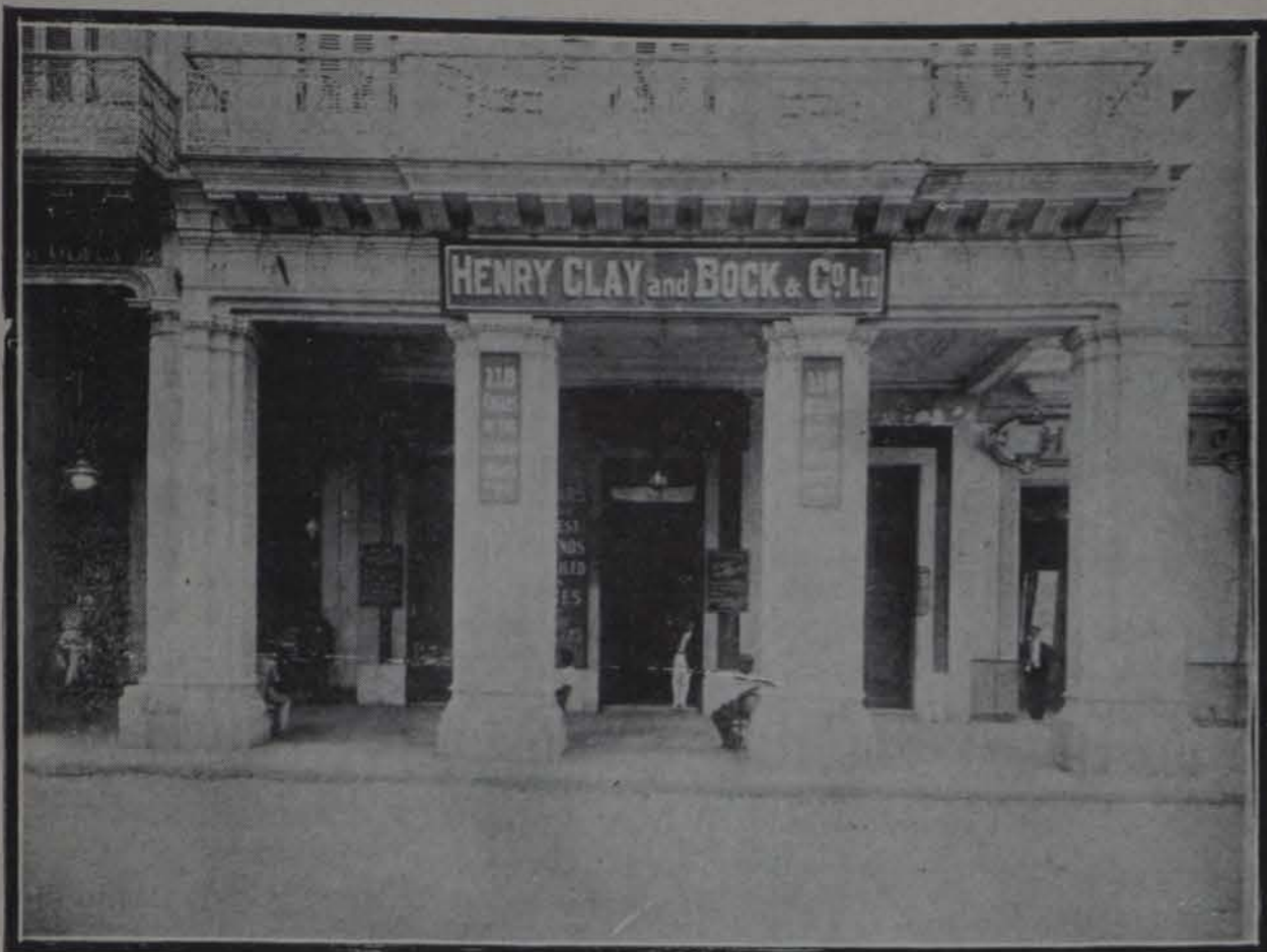
Fachada del "Salón Echemendía"