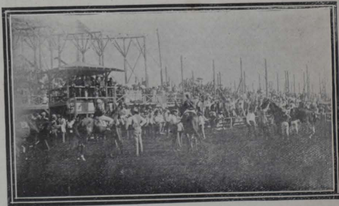
El Jurado y la concurrencia en las carreras y los Jockeys antes de empezar una carrera