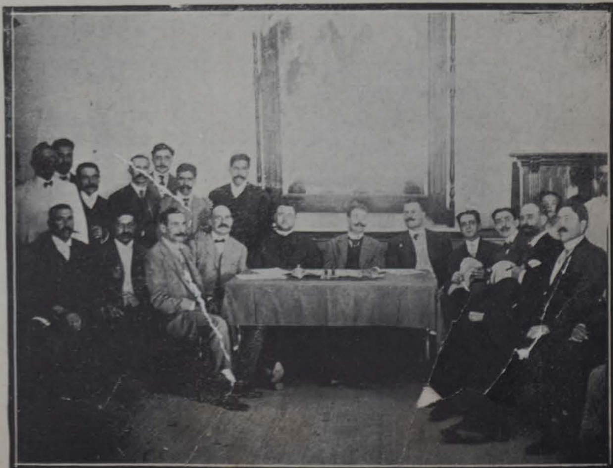
Recepción de los delegados del Centro Canario en Gijón