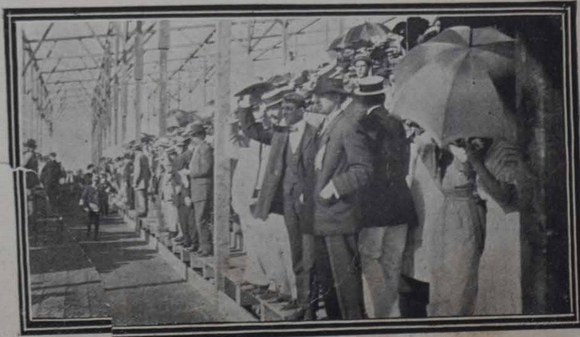
La concurrencia en el Hipódromo

um, y don este último para que an para lotación malo, no. Si ea bus tam re e la del pr mbolso son favor préstamo, e uscalizar es el fondo. La nos de caja, s, y sobre to último con ancos hipote éstamos, que por ciento del n por la mi refaccionarios, ipotecarios co tito apreciable; generales y de do CANCIO. ECIDA nos honraron el Recojieron nues atavío y á su gus mos ni tenemos sar nuestra gra BA Y AMÉRICA. abé Boza El Triunfo en sus ajo la triste nue al Boza, uno de stas, y cuyo nom servicios milita la revolución del to joven. La glo s libertadores de recuerdo. AITI de Port-au-Prince, corial de su edición a cuenta de la intere sidente de aquella da por sangrientas ndiencia pública al —nuestro amigo y e Armas—el perdón piración refugiados o. ESTADOS UNIDOS er en Norte América s de llamar la aten te muestra que más eres se ocupan en las Hay, hoy día, tres de las que había ha ro de tenedoras de li e ha doblado. Las de ntado en igual cantidad. legado allí á ser tesoreras ncos, presidentas de Ban e ahorro, secretarias de larios de diez mil y doceni