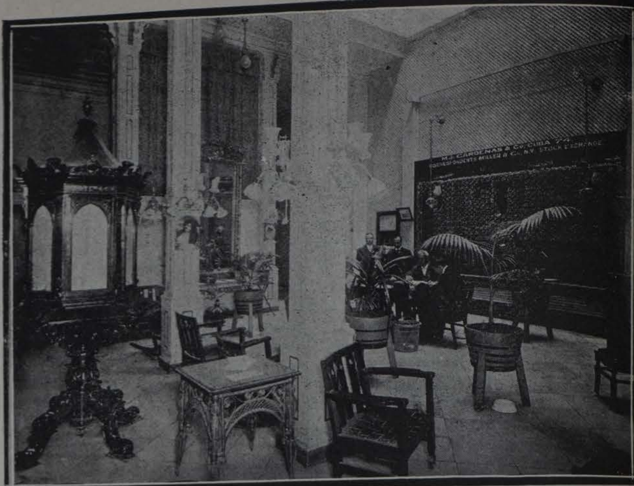
Las cotizaciones de bolsas en el "Salón Echemendía"