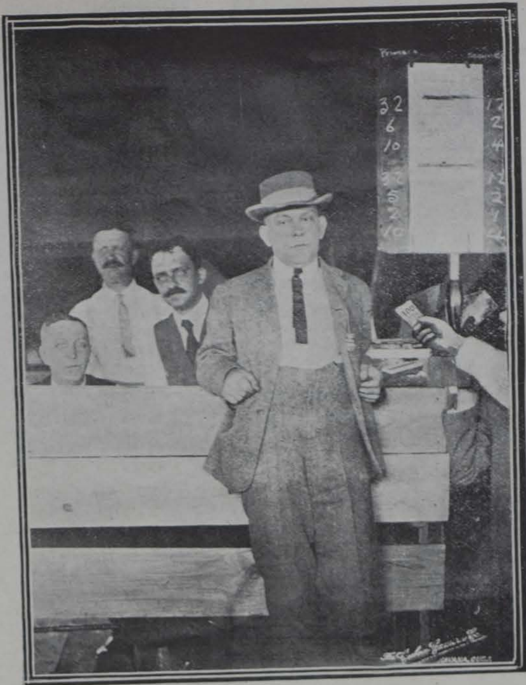
Palco del Jurado en las carreras

Los festejos avanzan y cada nuevo número es objeto de las celebraciones del público que acude en gran cantidad á contemplarlo, y muestra bien claro el regocijo que le produce y el interés que le despierta. Por más de un mes todo el pueblo de la Habana, gran parte de habitantes del interior del país y muchos extranjeros se habrán divertido grandemente, pensando quizás, los últimos, que este es el mejor y más privilegiado lugar de la tierra. Todo eso, en suma, habrá costado apenas cien mil pesos de suscripción, y de seguro que ha hecho circular más de quinientos mil. Así es el dinero, que se retrae y huye, como el más tímido, pero que sale y se desborda en cuanto adquiere un poco de confianza. Pensando en su empleo, no podemos menos de recordar que en tiempo no lejano y en poco más ó menos espacio que los festejos, se gastaron ocho millones de pesos en conseguir que el país perdiera su prestigio, su dignidad y su valor. De una magnífica propiedad llena de crédito, se hizo una finca hipotecada, sin producción y pro-indivisa. Es bien extraño que los que produjeron aquella insensata situación, pretendan gobernar el país y dirigir sus destinos; pero es más curioso aún, que el mismo país acepte tan funestos administradores. Ya se ha visto cuánto bueno puede hacerse, con muy poco dinero, y qué estación más prolongada y dichosa se hubiera conseguido con esos ocho millones de pesos que se han gastado en pagar unas comparsas sin lucimiento y sin brillo.....—DOLORES.