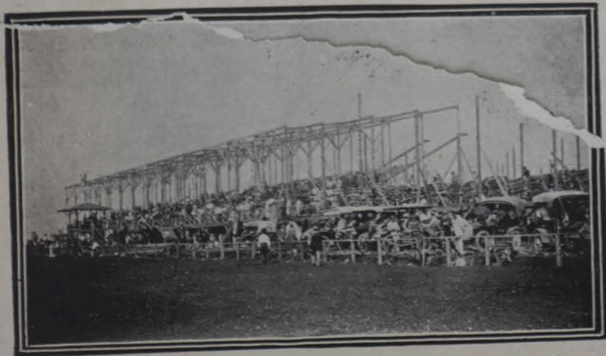
Una vista de la glorieta en el Hipódromo