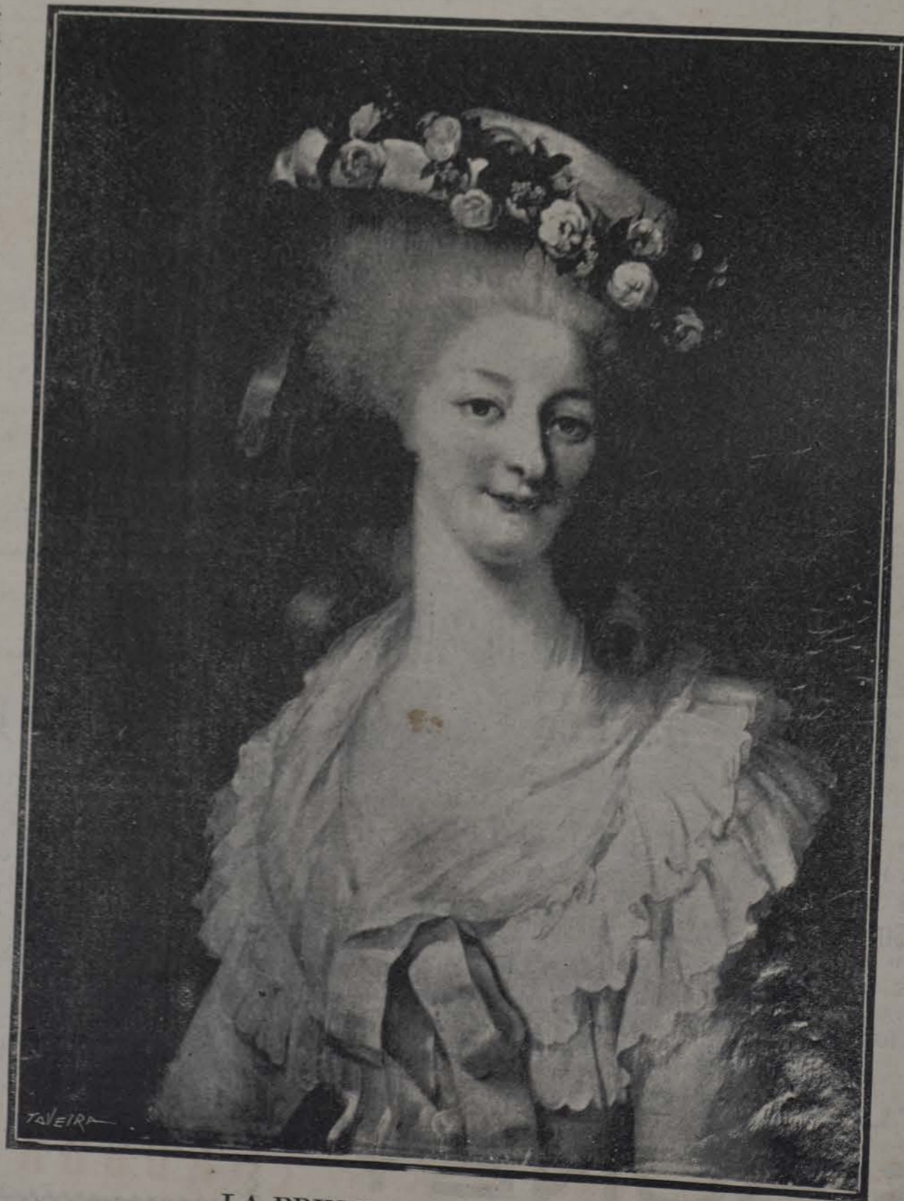
LA PRINCESA DE LAMBALLE

No ocurre eso en los cafés de otros países como los Estados Unidos, por ejemplo; y toca al Alcalde velar porque entre nosotros adquieran carta de naturaleza los hábitos que dan el título de pueblo culto á otras sociedades.