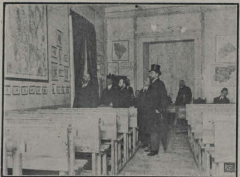
Una de las aulas