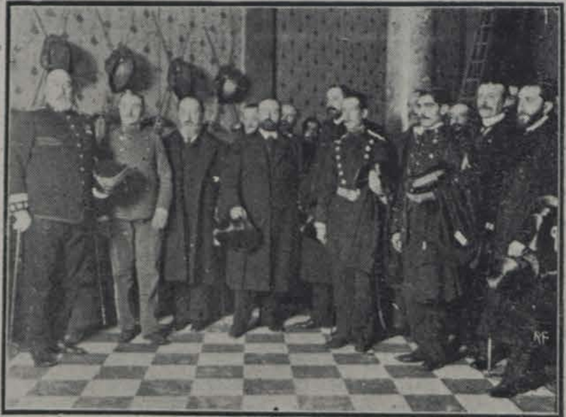
Inauguración de la nueva escuela de Policía en Madrid