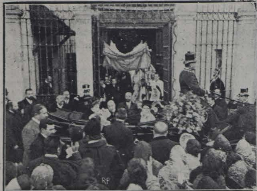
Los reyes de España llegando á la iglesia de la Paloma.—Madrid

Modesto y humilde, silencioso y pensador, lo veo pasar por las revistas y por las casas editoriales, como en aquellos paseos dados en su compañía por las rondas de Salamanca que tan varonil acicate clavaron en mi mente y en mi voluntad.