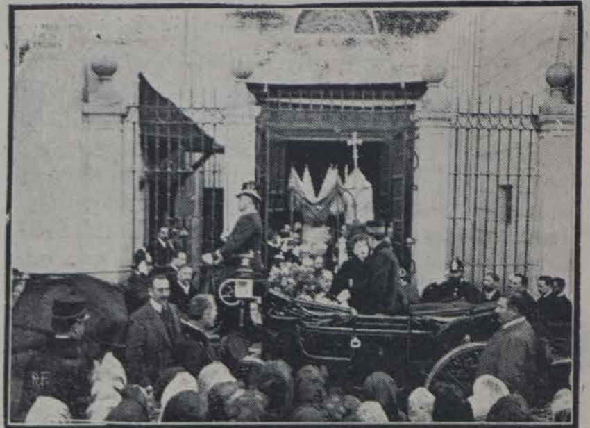
Los reyes saliendo de la misma iglesia