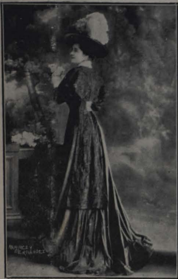
VESTIDO DE VISITA POR LAFERRIERE

Este elegante traje de la conocida casa de Laferriere de París, es de alta novedad. De terciopelo chiffon la falda que es completamente lisa, tiene una blusa bordada al pasado de marquissette con el cuello, plastrón y puños de encajes de Venecia. La man-