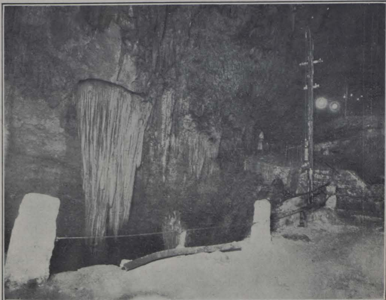
CUEVAS DE BELLAMAR.—MATANZAS

En 1905; 111 volúmenes, 151 folletos, 2323 cuadernos de procedencia extranjera; 174 periódicos, 24 hojas sueltas, 3 láminas y 47 para la vidriera del Museo. Además 22 co-