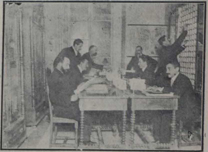
Oficina de Investigación