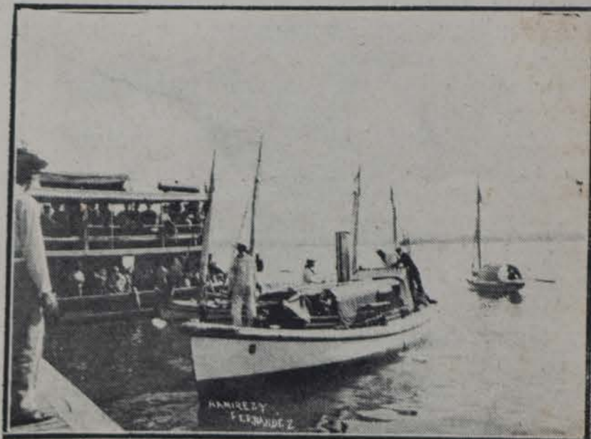
LA LANCHA DE "EL MOLTKE" EN EL PUERTO