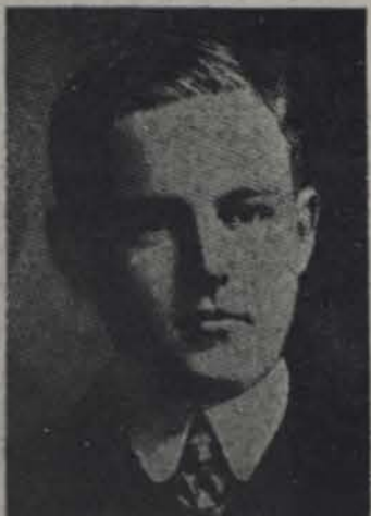
† LUIS FELIPE PRINCIPE DE PORTUGAL

Y el fervor republicano no puede reclamar la absolución del fanatismo y el crimen.