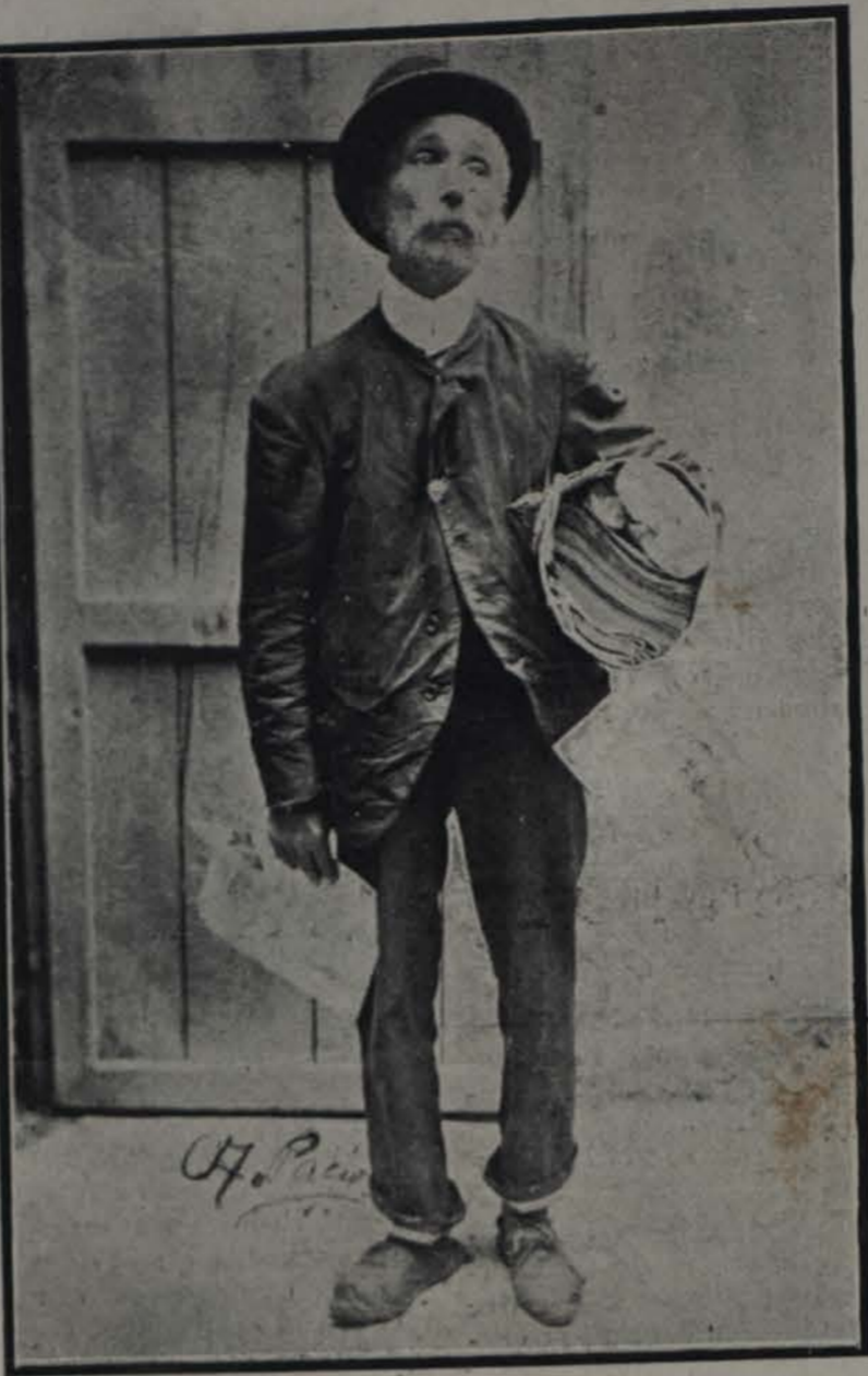
Como camina Trelles el vendedor de periódicos

A la charada anterior: Co-lo-ra-do. A la charada romana: La-va-do. A los anagramas: