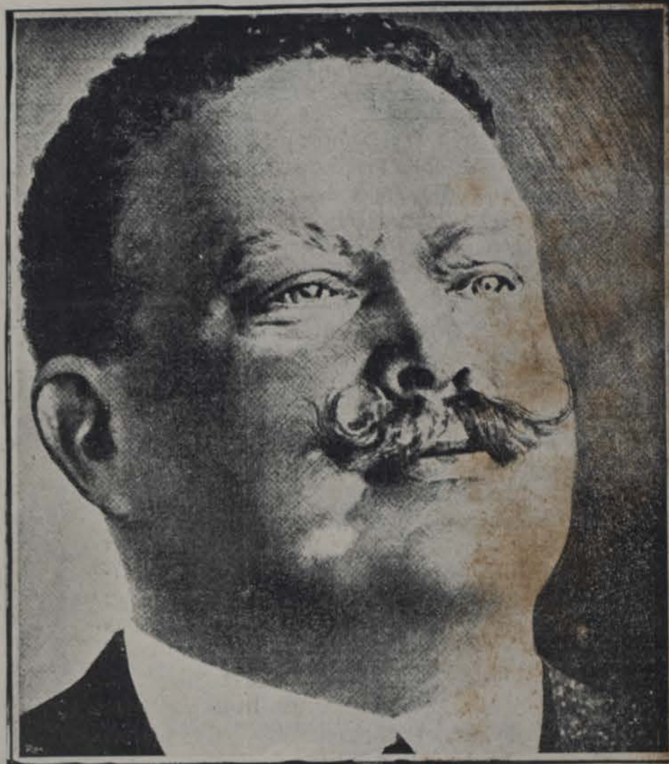
† EL REY DE PORTUGAL, CARLOS I