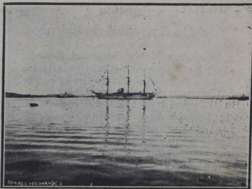
"EL MOLTKE", EL BUQUE ALEMAN EN EL FUERTO DE LA HABANA