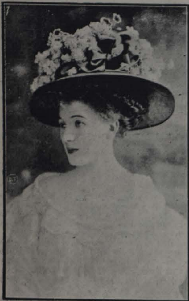
LA MODA POR ALPHONSINE

Este lindo sombrero creación de la conocida casa Alphonsine de París, ha sido un modelo muy celebrado é imitado por todo París, en varios colores; el de nuestro grabado es morado de dos tonos y las flores son violetas dobles. Cubren éstas literal-