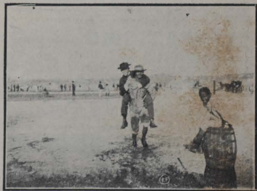
RECUERDOS DEL RAS POR UN AMATEUR.—CARGADORES PASEANDO CURIOSOS EN EL MALECON