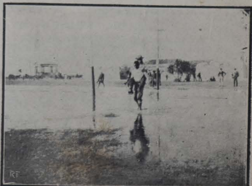
LA "NUNDACION JUNTO AL CASTILLO DE LA PUNTA