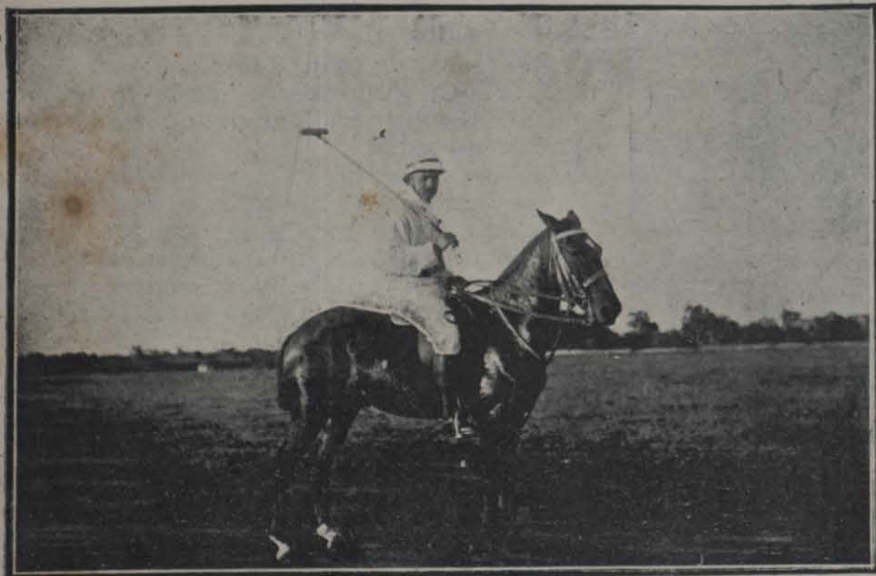
UN OFICIAL AMERICANO DEL "TEAM" DE POLO DEL VEDADO

*** El Diario de la Marina en sus telegramas ha anunciado que el viaje de Mr. Magoon ha tenido y tiene por objeto buscar formas de