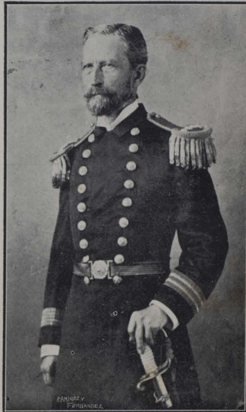
ANICETO MENCAL Célebre ingeniero cubano de la armada americana