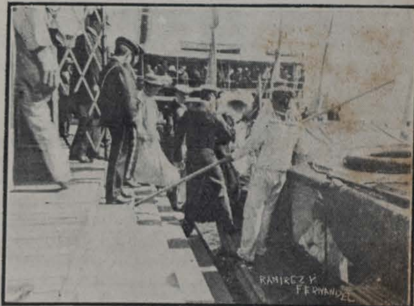
INVITADOS LLEGANDO A "EL MOLTKE" PARA FESTEJAR EL CUMPLEAÑOS DEL KAISER GUILLERMO