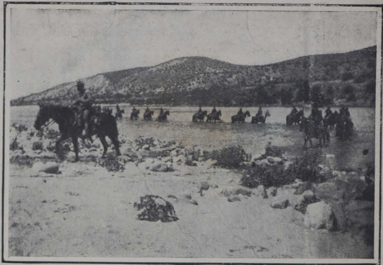
UN ESCUADRON DEL EJERCITO REGULAR AMERICANO VADEANDO EL RIO NEGRO.—ARIZONA

El ansia de convertirlo todo en dinero sonante ha cegado á muchos pensando en la enagenación de esos terrenos para fines industriales. Sería un atentado á la salud pública y al ornato. Y que aquel espacio de terreno con los de la Avenida de las Palmas sea lo poco que nos quede del recinto de las murallas que la rapacidad fiscal prodigó, torpemente y para nuestro daño.—H. URBANO.