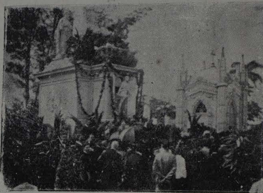
En el Panteón de los Estudiantes