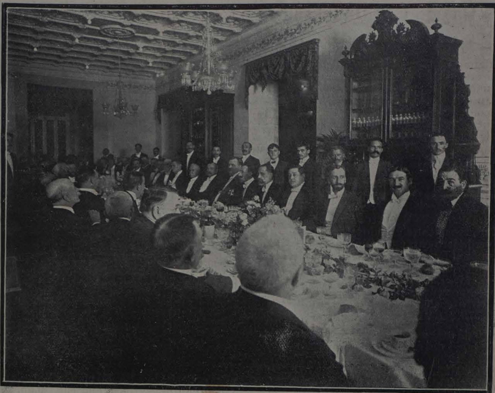
Banquete de la Cámara de Comercio en el Gran Hotel al Gobernador Provisional