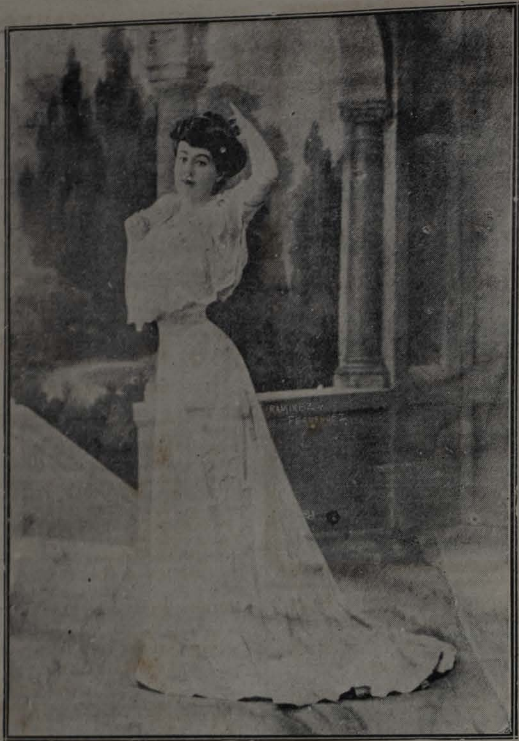
Vestido de seda por Lachartroulle