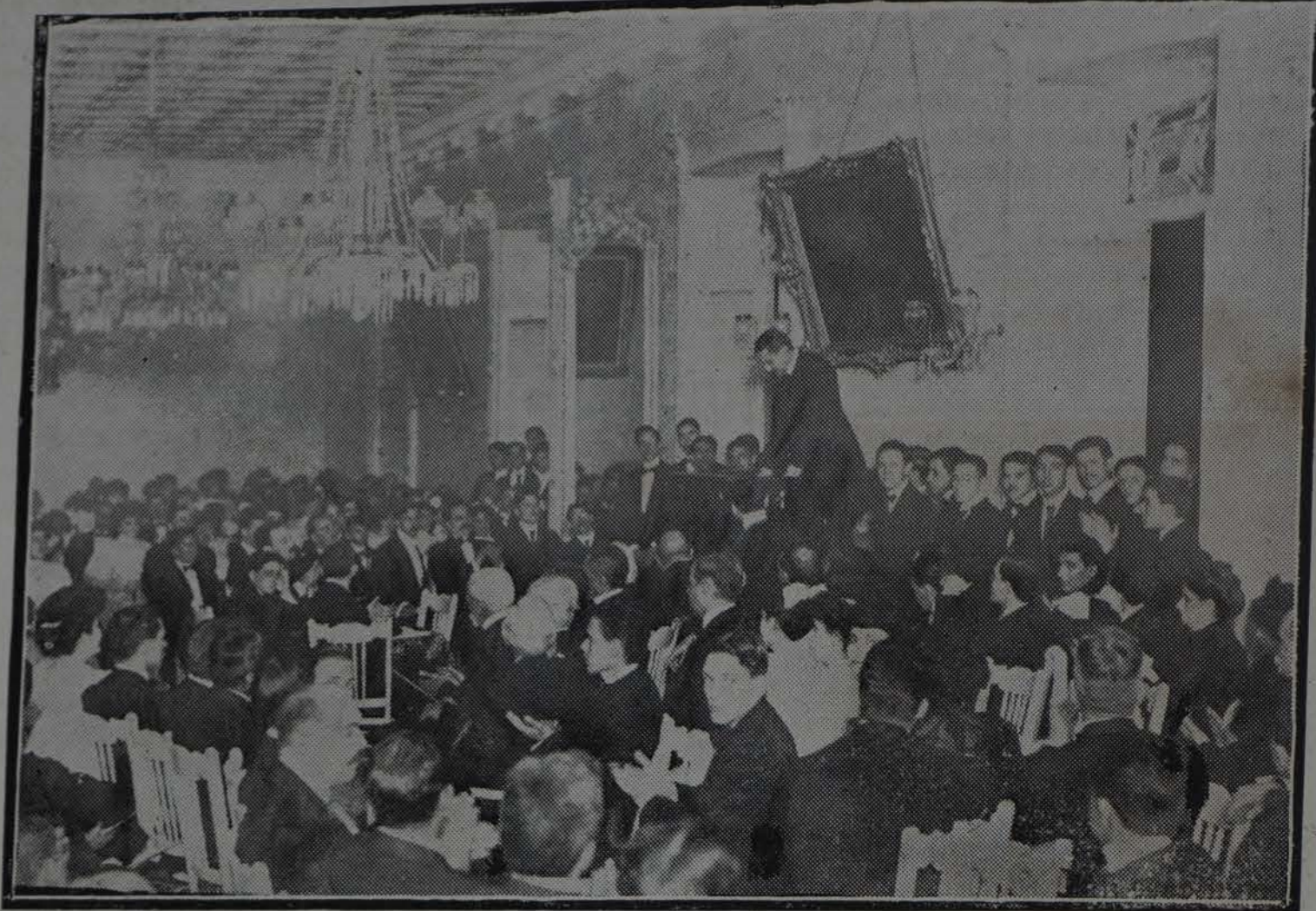
La conferencia del Ateneo el 27 de Noviembre, por la Asociación Cívica Universitaria

ción política, lo segundo por el estado de nuestros Ayuntamientos, requiriéndose por tanto un régimen de ensayo del self government procurando fortalecer su Hacienda é irles acostumbrando á la propia y libre administración de sus intereses.