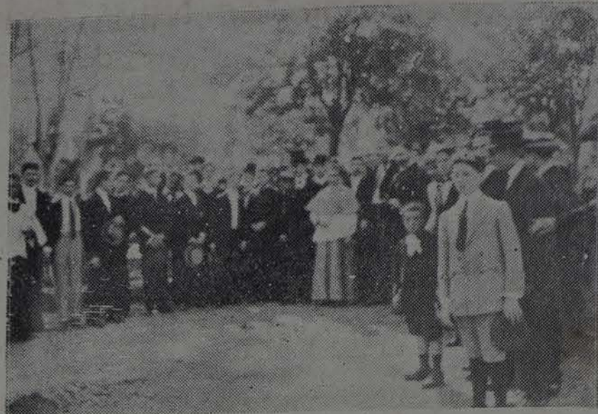
Concurrentes en el Cementerio, entre los que están el Gobernador Provisional, el Gobernador Civil y el Obispo