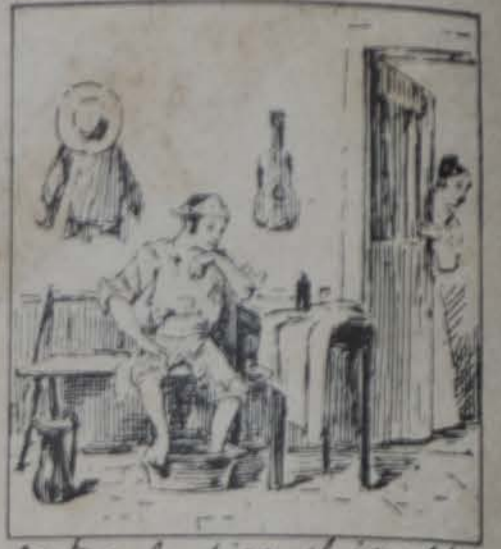
Antes, te dice el inglés, Vaya á lavarse los pies.