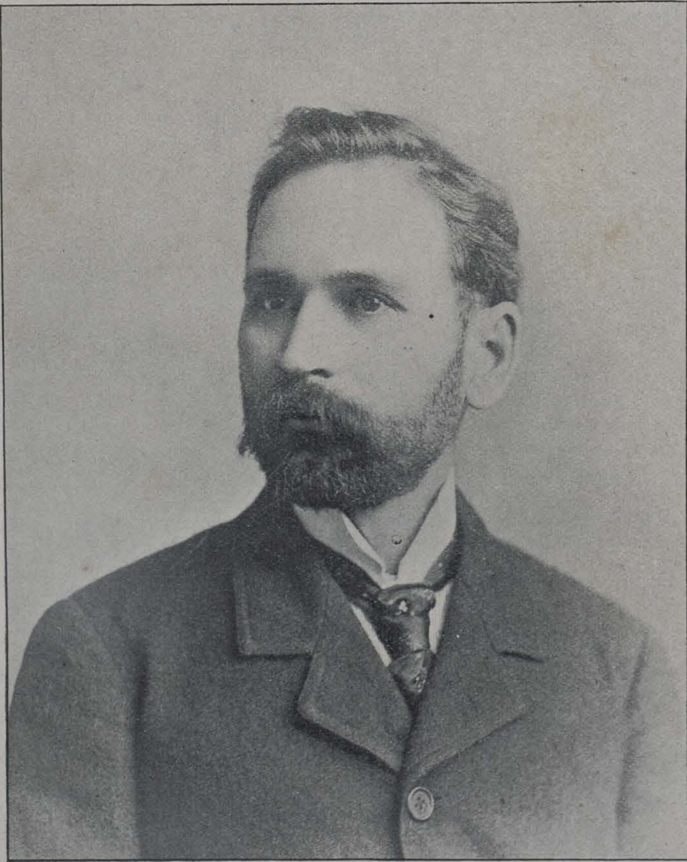
GENERAL EMILIO NUÑEZ.