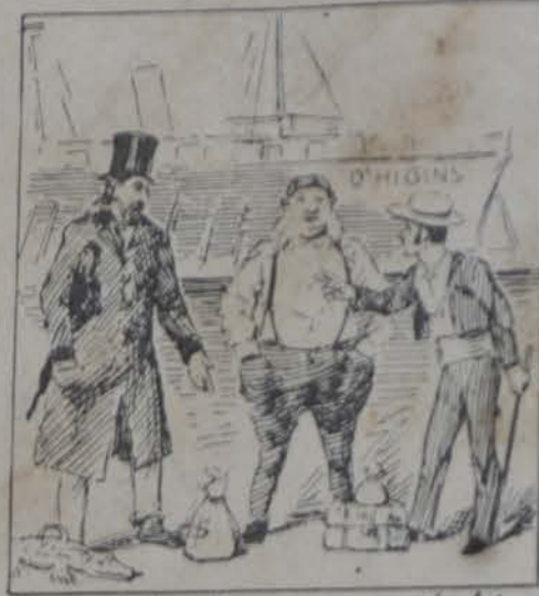
Paga el Mister con doblones Y el torero con cupones.