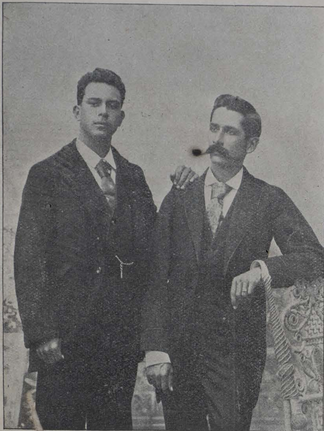
Cesar de Salas y Francisco Gómez.

EL presente grabado exhibe dos de las figuras más interesantes de la Revolución cubana; porque, en sus hechos, en su devoción á la causa de la patria, en su resolución ardorosa y juvenil y en su temprano martirio, se encarna por decirlo así el espíritu de abnegación, de olvido propio y heroísmo de la juventud cubana.