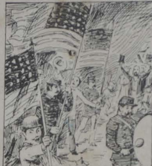
Para Oriente van marchando. ¡Pando definen á PANDO!