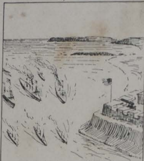
Aquí estaban la Cabana, La PUNTA, EL MORRO... y ESPAÑA.