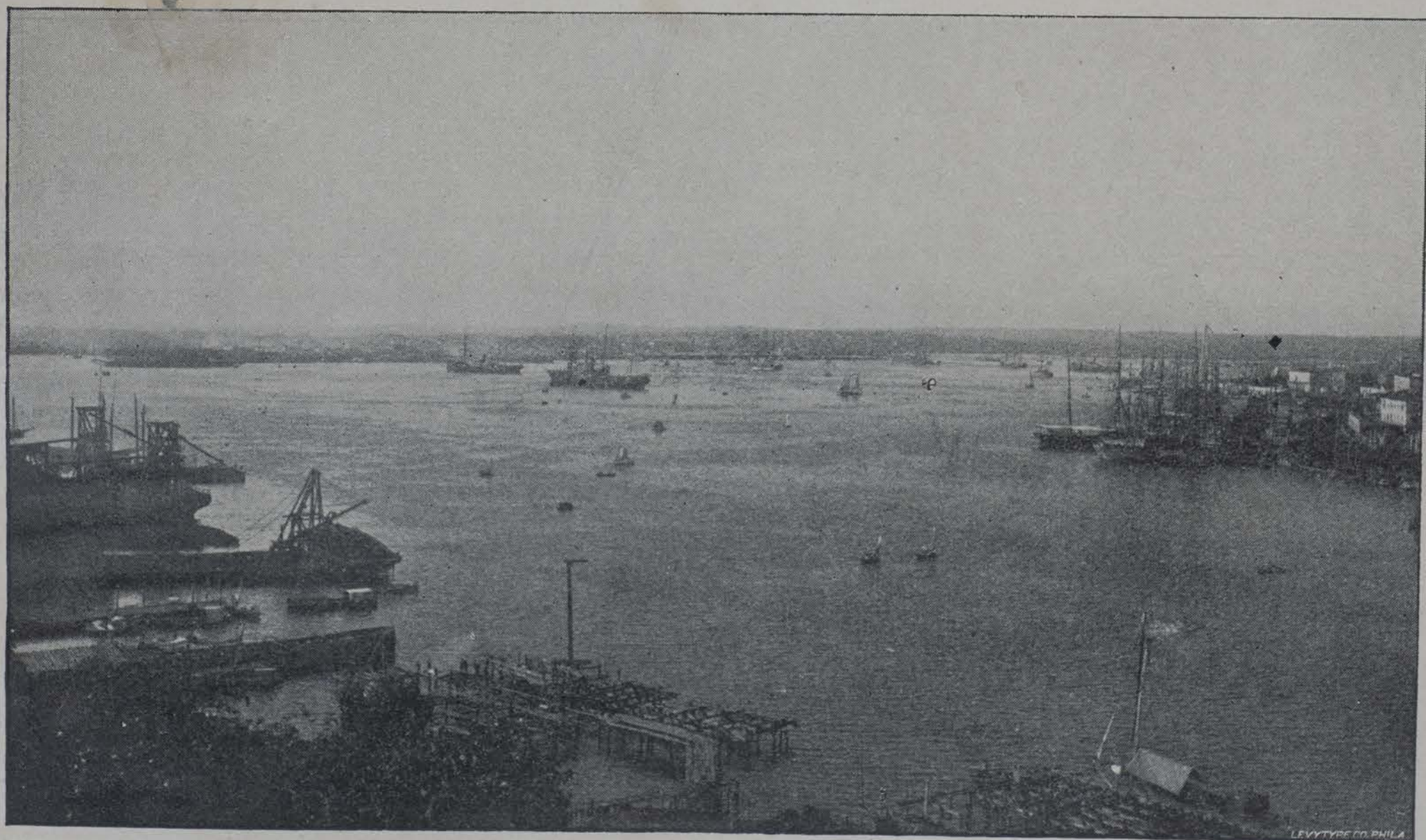
Interior de la bahía de la Habana.

Otro gran solitario fué Quintana, primer expositor en nues-