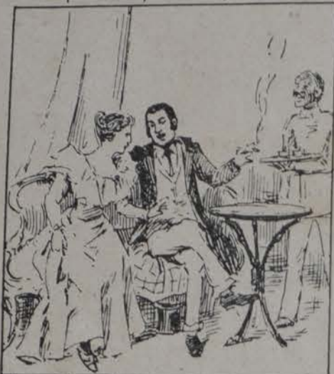
Se vistió de caballero Y entonces... halló un crucero.