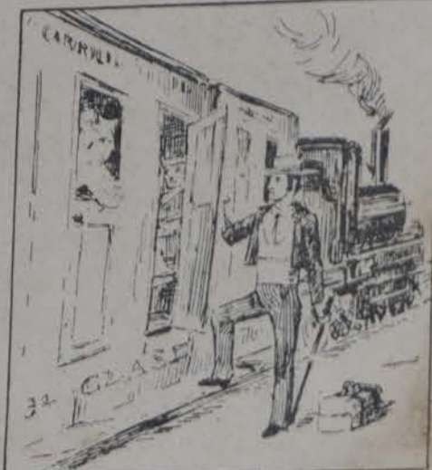
Y el torero tomó el tren Y fué por buques también.