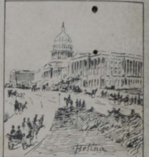
Aquí al toro de Castilla Le clavarón la puntilla.