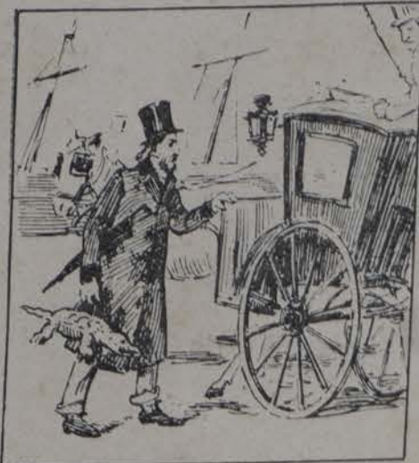
MacKenley lo envió a Inglaterra A compra buques de guerra.