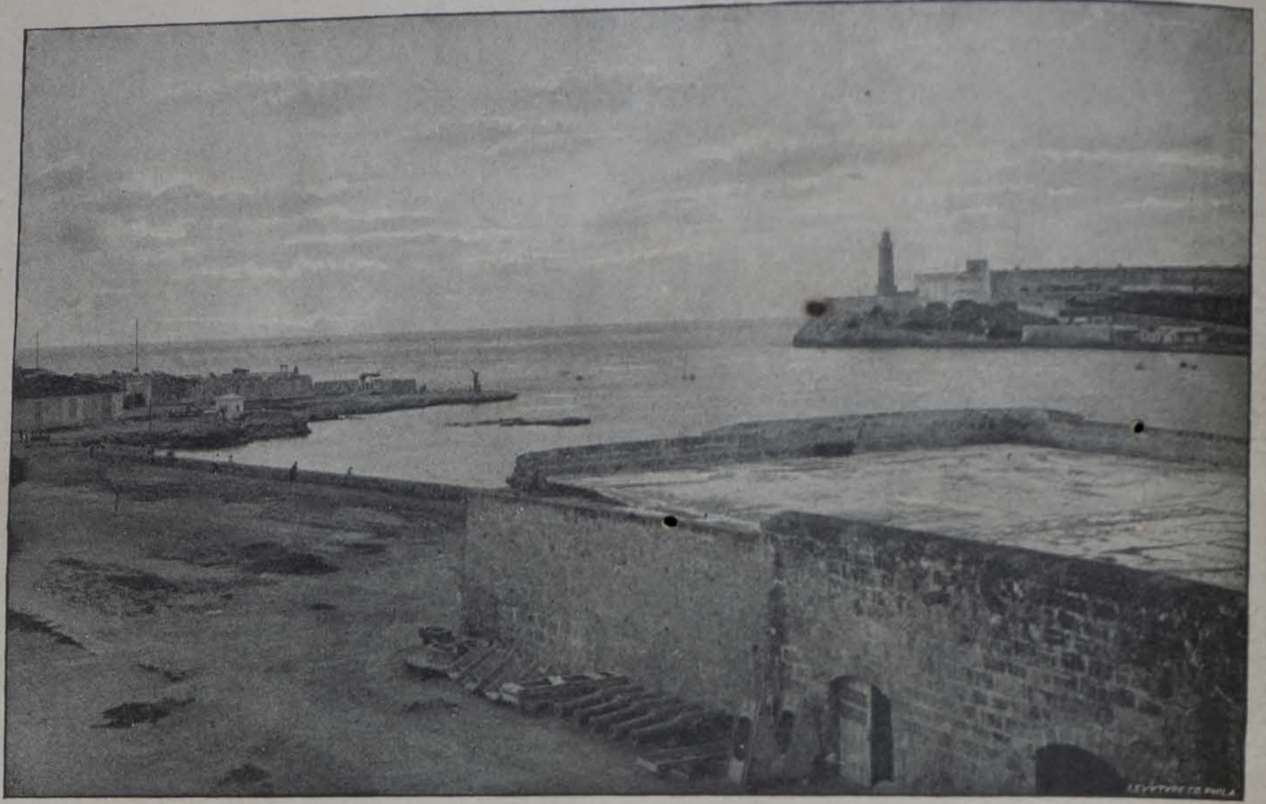
La batería de la Punta y el Castillo del Morro á la entrada del Puerto de la Habana.

Respecto á Cuba, creyó en la autonomía; pero desengañado