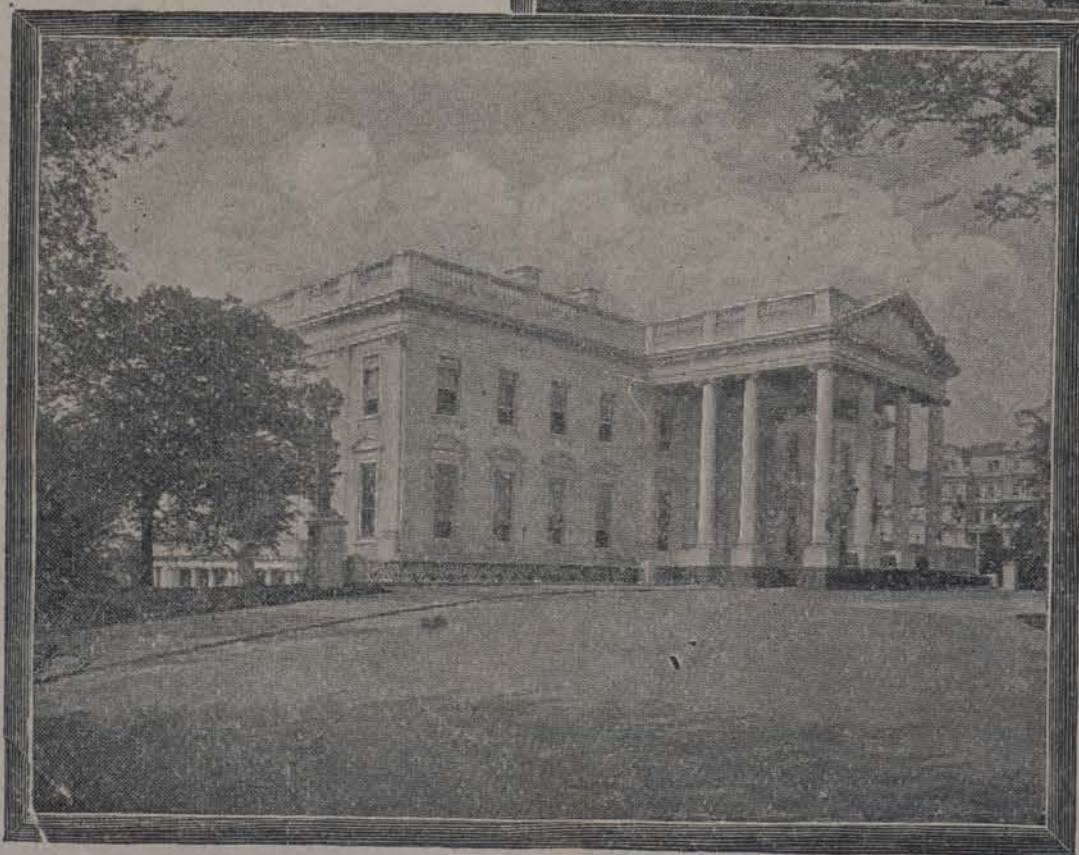
La Casa Blanca, por su fondo.

mosos parques de 80 acres, (sellados de árboles, arbustos y embellecidos por estatuas, jardines y juegos de agua,) á los cuales tiene acceso el público en las tardes de primavera y verano.