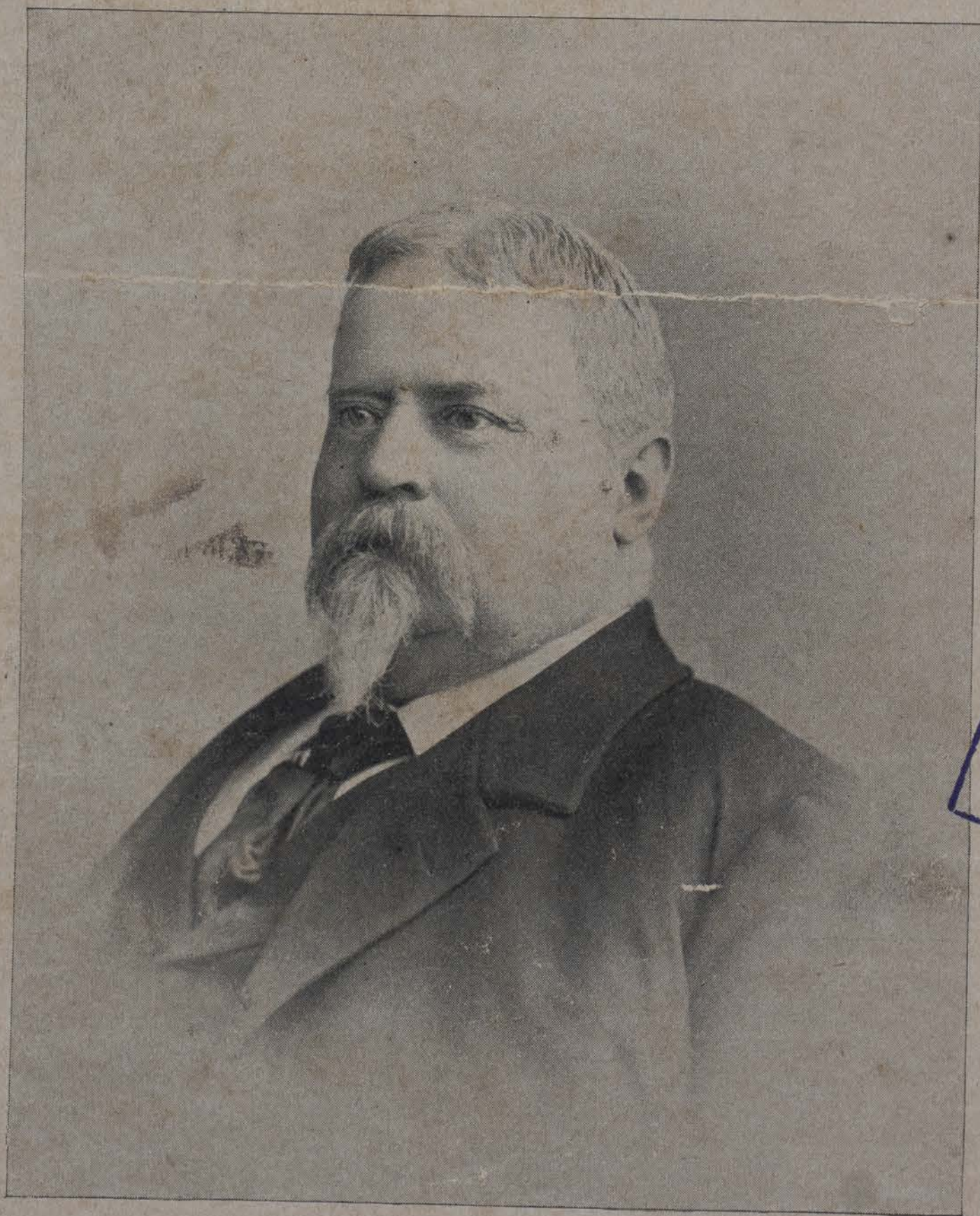
GENERAL FITZHUGH LEE.