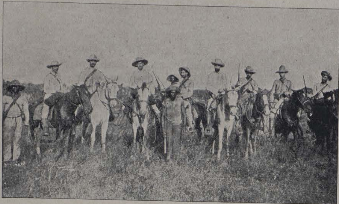
El General Lacret y su Estado Mayor.