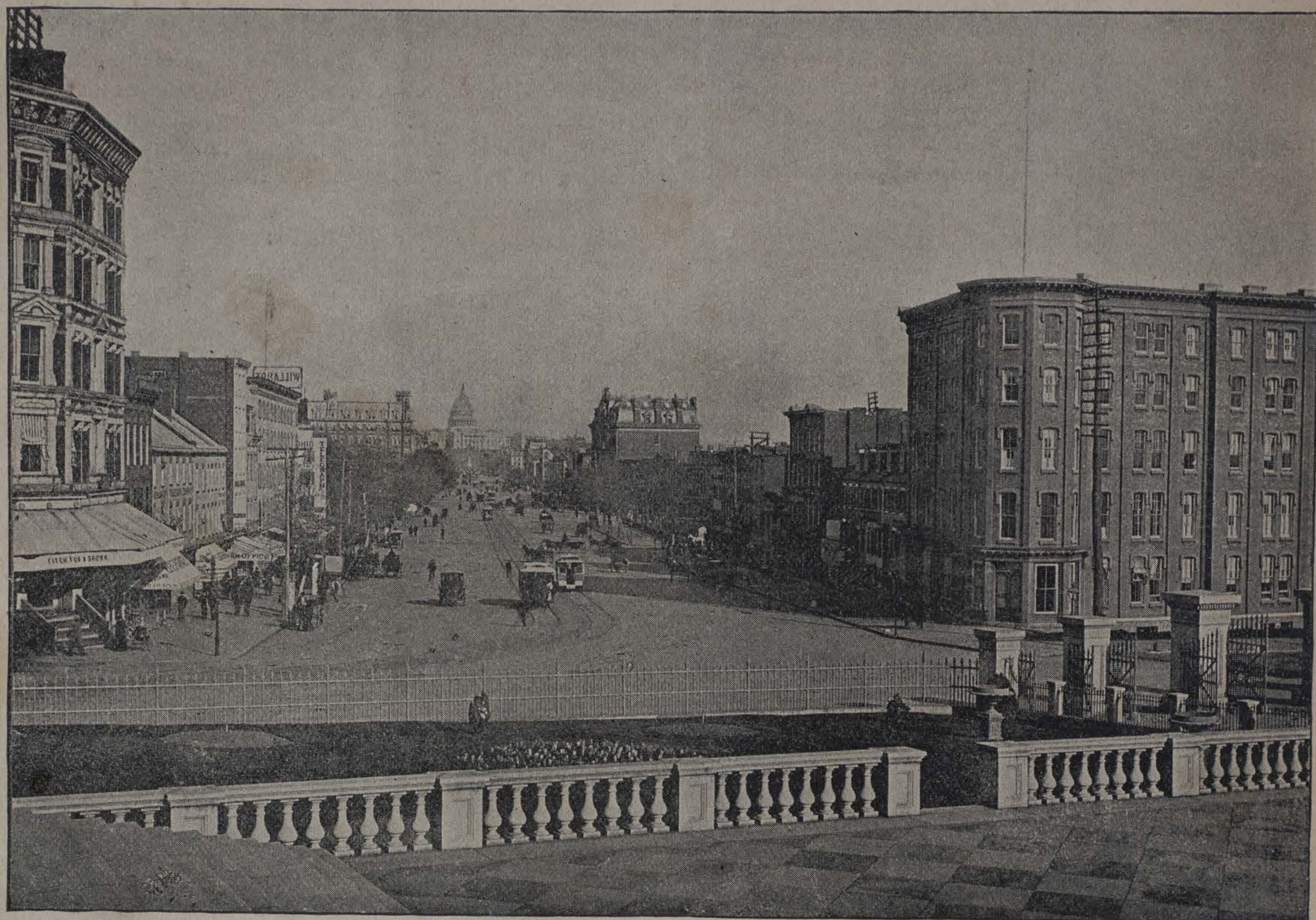
AVENIDA DE PENNSILVANIA, WASHINGTON.—VISTA DESDE LA TESORERIA.