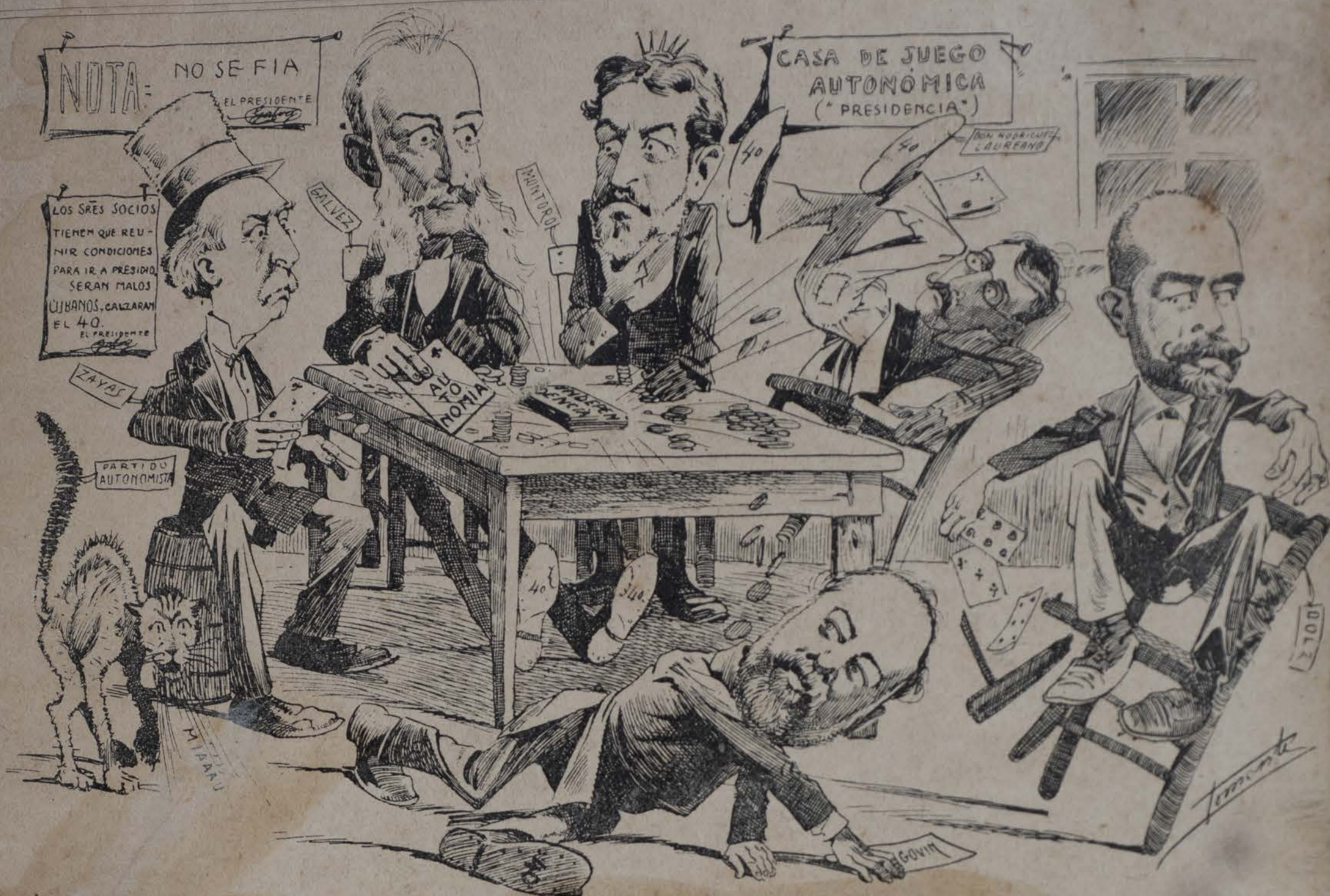
¡¡ Carta á la puerta !!

pulgadas, balas de morteros, mil libras de peso, $195 cada