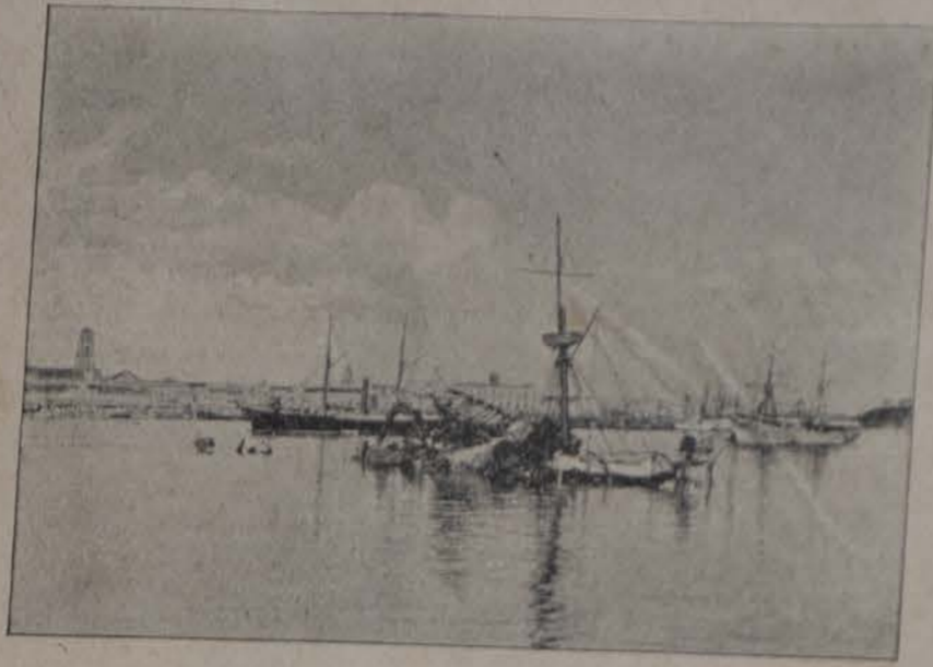
Restos del Maine en el Puerto de la Habana.

prólogo de la futura historia de la patria. Esperemos.