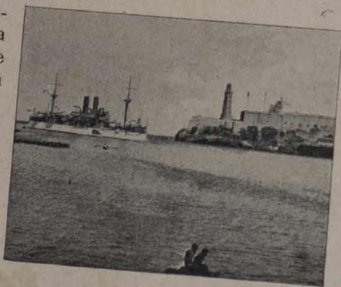
El Maine entrando en el Puerto de la Habana.

Cuba, la isla ensangrentada, parece que está llamada á que sus destinos se resuelvan entre lagos de lágrimas y alaridos de duelos.