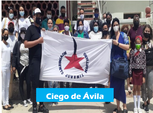
Ciego de Ávila