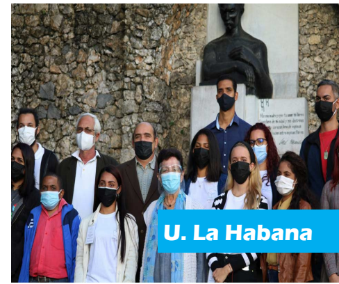
U. La Habana