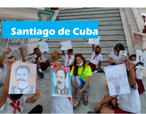
Santiago de Cuba