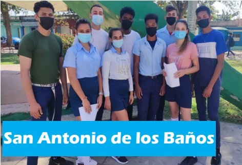
San Antonio de los Baños