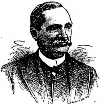
TOMAS ESTRADA PALMA

La primavera torrencial hacia que mi marcha fuese lenta y pesada. Sin embargo, el día 5, y á volapié de caballo, atravesé crecido el Jobabo y entré, puedo decir victorioso, en los límites de la comarca camagüeyana, y, coincidencia feliz, el mismo día Salvador Cisneros Betancourt se lanzó al campo con más