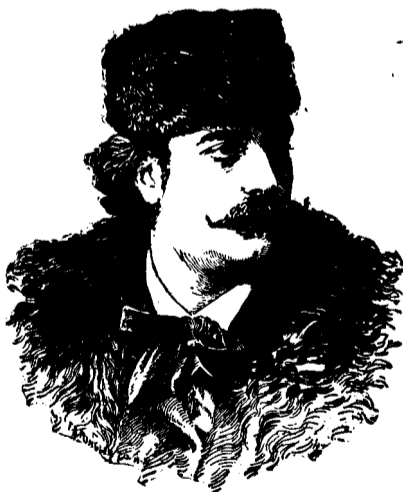
RAFAEL DIAZ ALBERTINI.

Per eso al saludar á Díaz Albertini, los cubanos han tenido una hora de alegría; por eso al oír los aplausos entusiastas que le prodigaban todos los