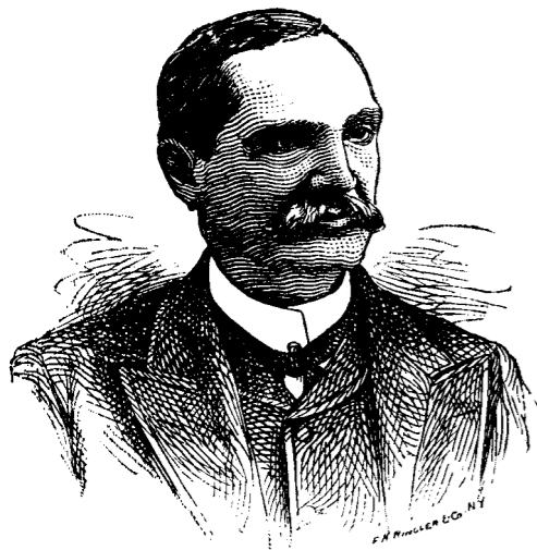
TOMAS ESTRADA PALMA

El bufete de un cubano está de plácemes, el bufete de Rafael Govin. En pleitos de marcas, que suelen ser de mucha monta, tienen Govin y Jones conocimientos especiales; y acaban de ganar una disputa muy sonada en pro de la fábrica de bromocaféina. Ocasión es lo que necesita el cubano para distinguirse. El cubano es por naturaleza, magüer díceres, mozo de empuje y triunfo.