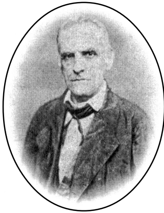
José de la Luz y Caballero (1800-1862)